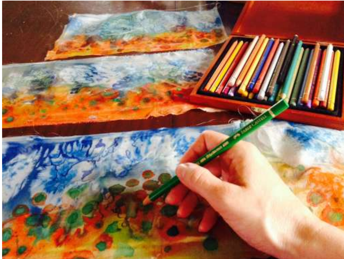
Ζωγράφισμα με παστέλ