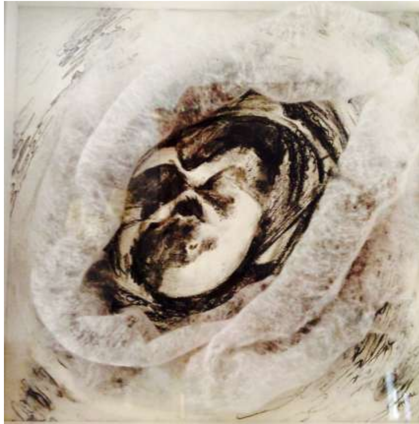
Κάρβουνο και μωρομάντηλα σε χαρτί 22x22cm