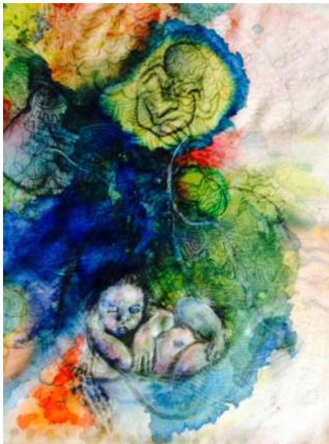
Ακρυλικά, μελάνι και κάρβουνο σε μετάξι 30x40cm