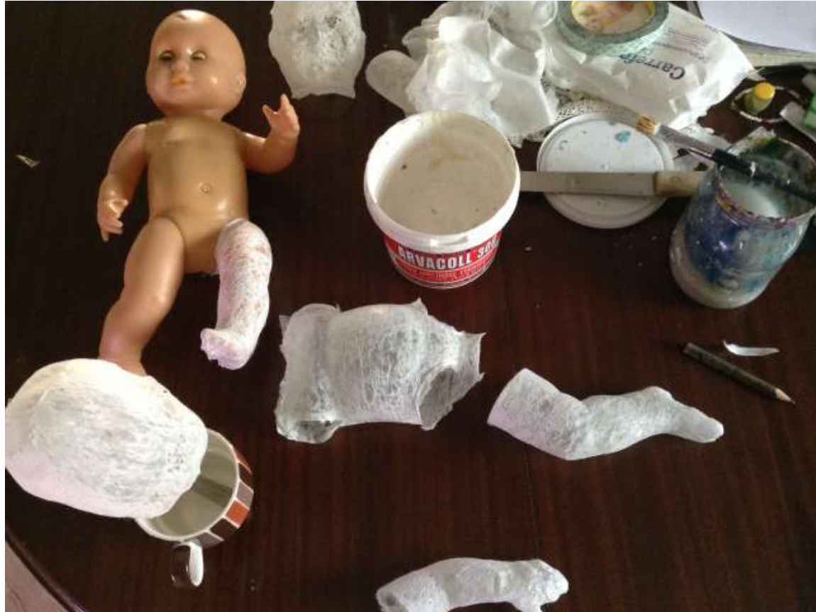
Συναρμολόγηση και κόλληση των επιμέρους κομματιών (I)