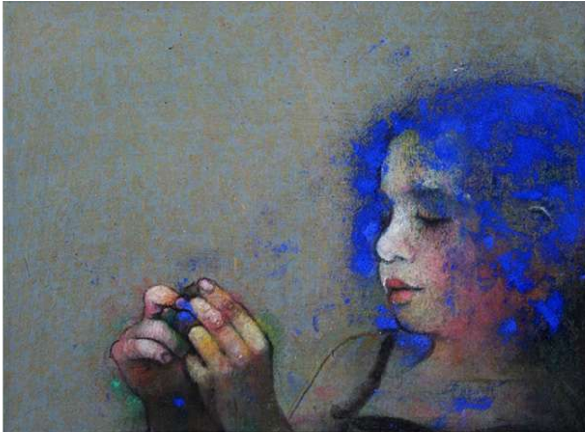
Μαρία Γιαννακάκη, Τα μπλε μαλλιά , 24x32cm, παστέλ και ξυλομπογιά σε μετάξι, ιδιωτική συλλογή, 2010