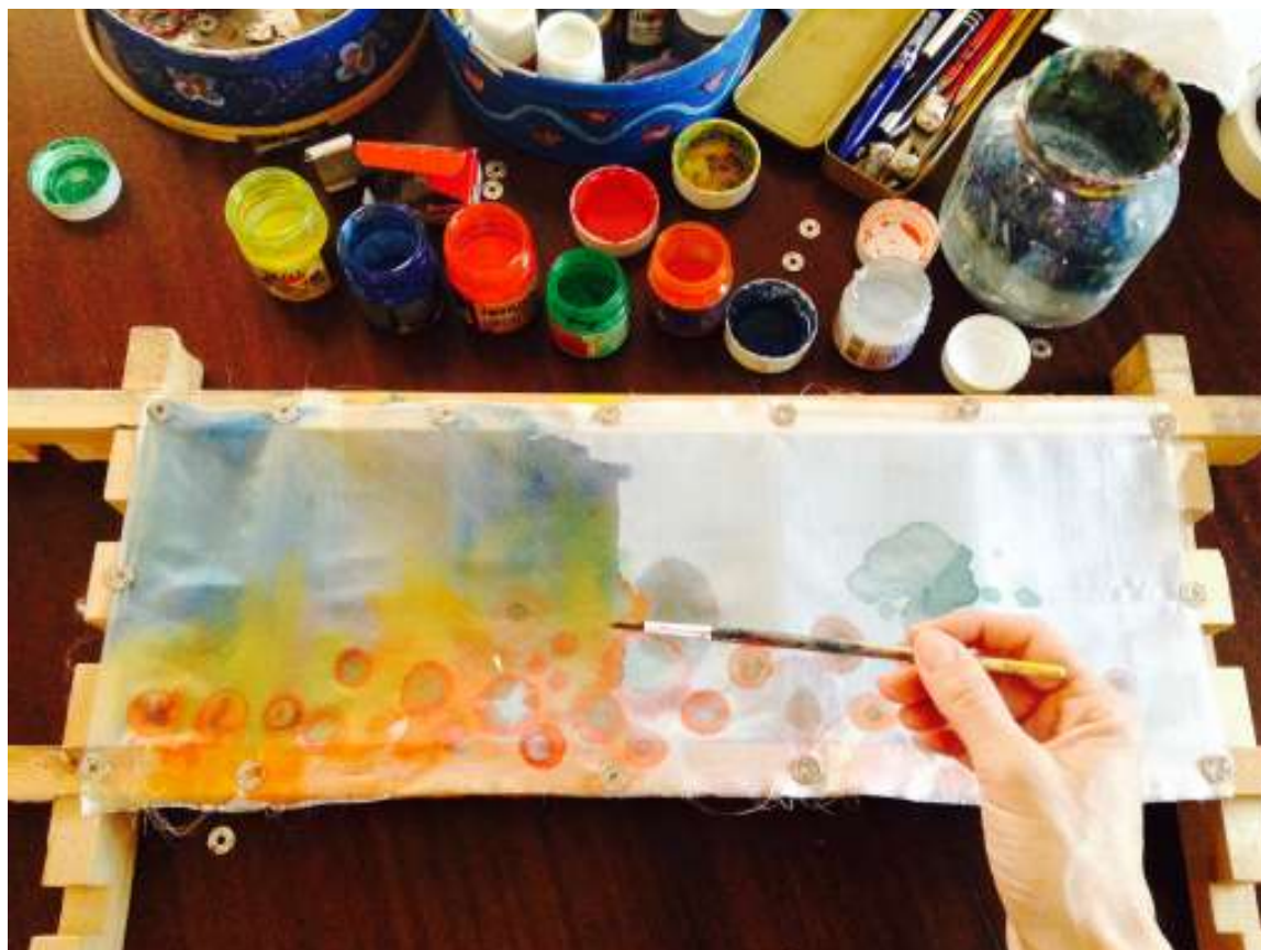
Ζωγράφισμα με τα ειδικά χρώματα