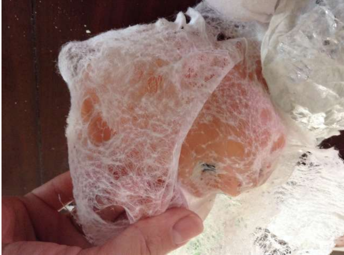
Τοποθέτηση μωρομάντηλου στην κούκλα