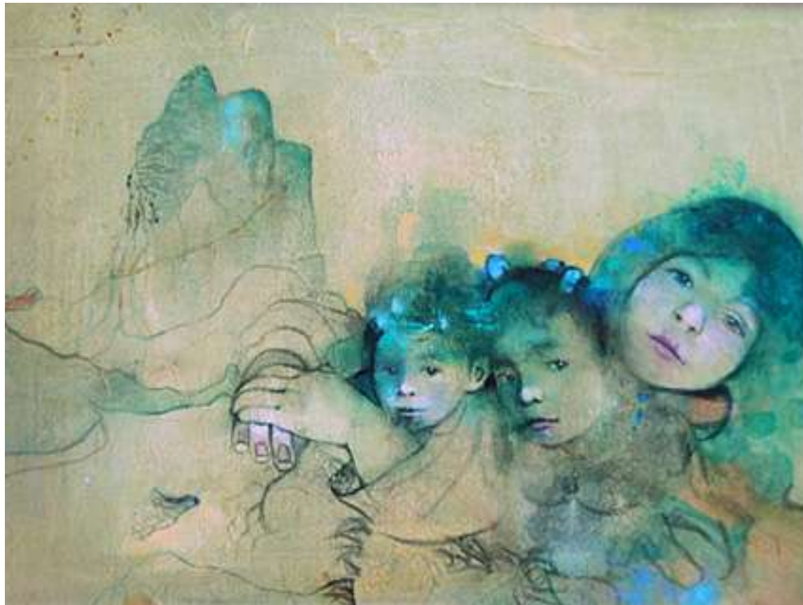
Μαρία Γιαννακάκη, Σμαραγδένιες ουράνιες ευχές , 40x50cm, ακουαρέλα και μελάνι σε μετάξι, ιδιωτική συλλογή, 2010