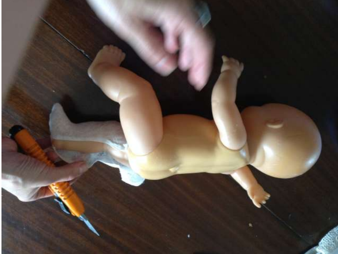
Αφαίρεση τμημάτων. (II)