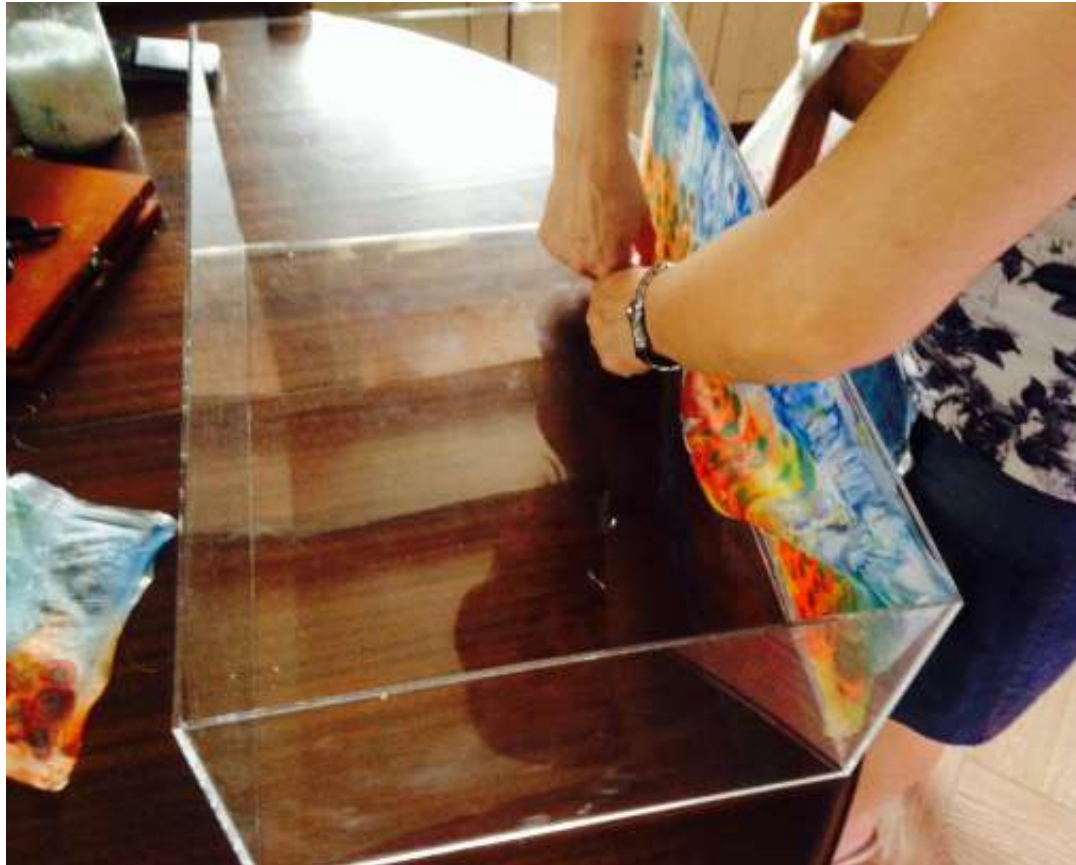
Κόλληση των μεταξωτών κομματιών στο κουτί από plexi-glass. (I)