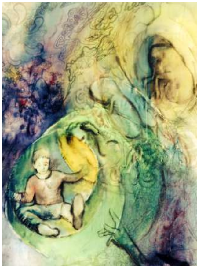
Ακρυλικά, μελάνι και κάρβουνο σε μετάξι 30x40cm