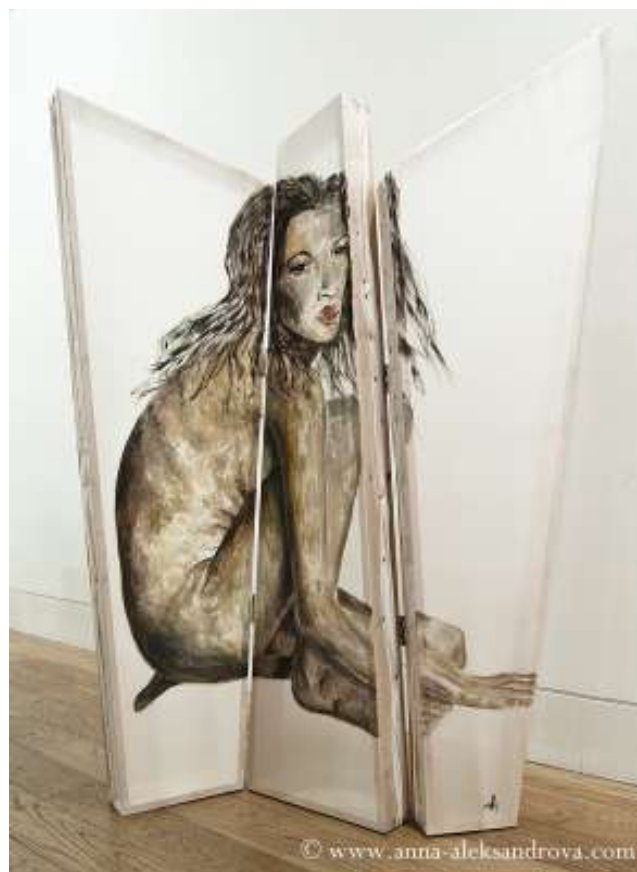
Άννα Αλεξάντροβα, Άτιτλο τρίπτυχο, 200x150cm, λάδι σε μετάξι, ανήκει στην καλλιτέχνίδα, 2012.