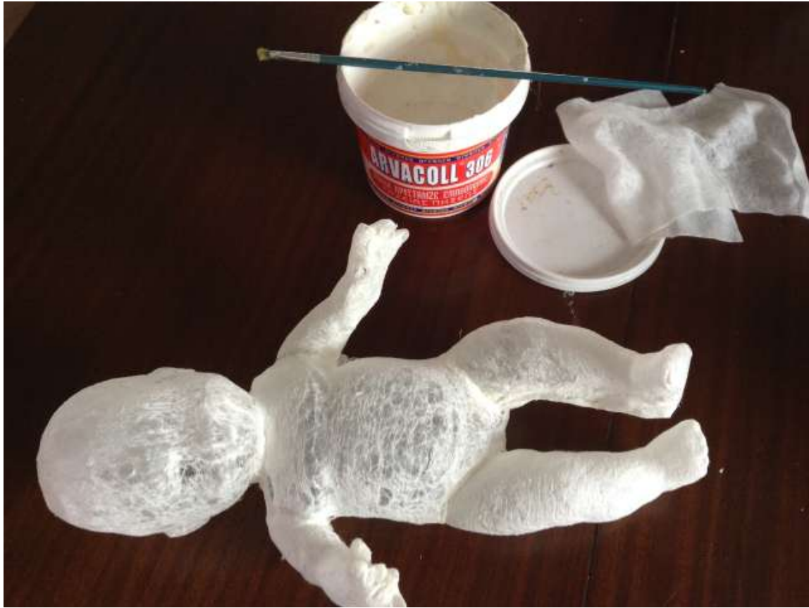
Συναρμολόγηση και κόλληση των επιμέρους κομματιών (II)