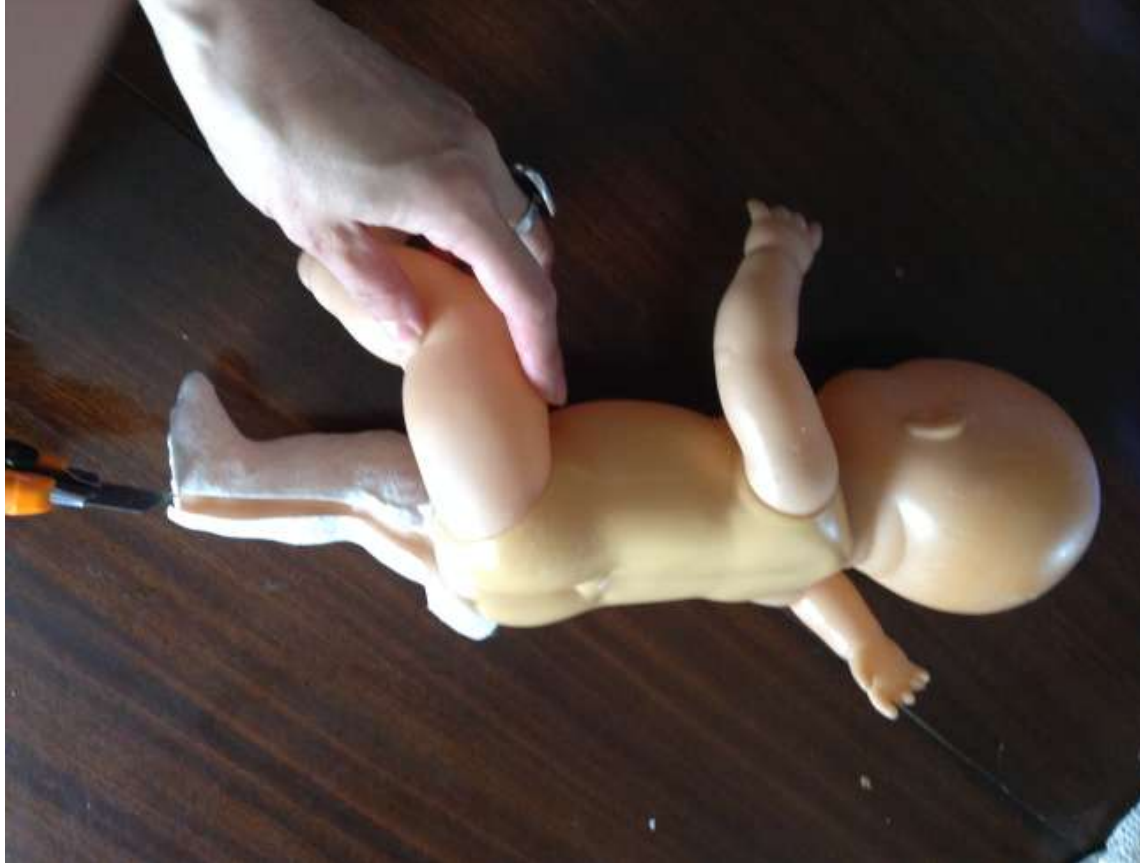
Αφαίρεση τμημάτων. (I)