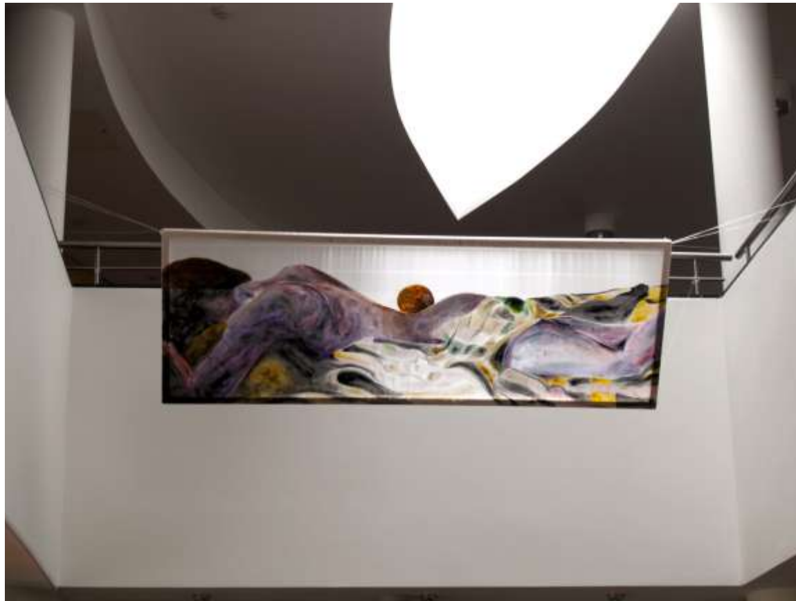
Άννα Αλεξάντροβα, The girl next door , 210x60cm, λάδι σε μετάξι, ιδιωτική συλλογή, 2011