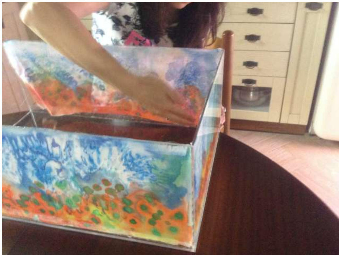
Κόλληση των μεταξωτών κομματιών στο κουτί από plexi-glass. (II)