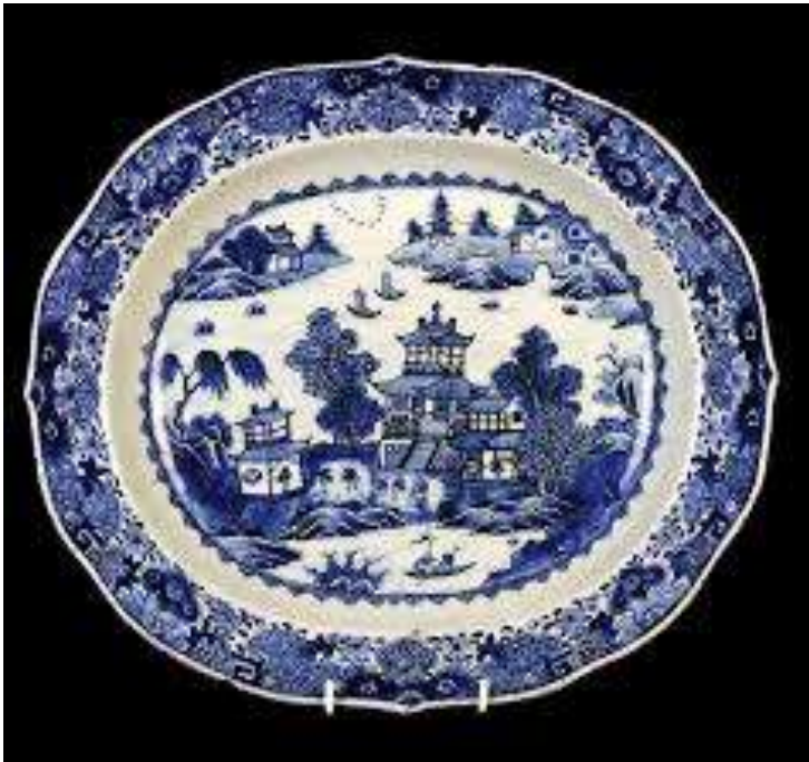
ΚΙΝΕΖΙΚΟ ΠΟΡΣΕΛΑΝΙΝΟ ΠΙΑΤΟ