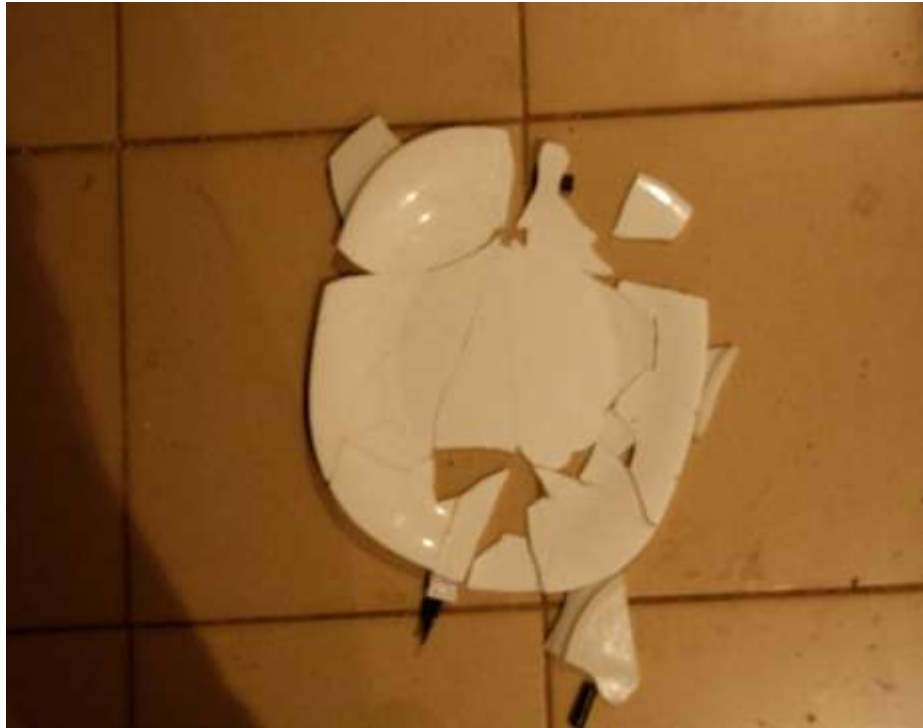
ΤΟ ΠΙΑΤΟ – ΤΡΟΧΟΣ ΤΗΣ ΤΥΧΗΣ

Το αποτέλεσμα είχε μεγάλη σχέση με την κινητήρια δύναμη για αυτήν την ιδέα (βλέπε “μεγεθυντικό φακό”). Η πορσελάνη όπως και το γυαλί μετά το σπάσιμο, έγιναν μικρά κομμάτια του υλικού τους. Κατά την προσπάθειά μου για την επανένωση του πιάτου, φαίνεται η δυσκολία του υλικού να επανέρθει στην αρχική του μορφή αλλά και η τάση που έχει να μοιάζει με αρχαιολογικό εύρημα, (ρογμές, σπασίματα, μη-ολοκληρωμένο κλπ.). Αυτή η διαδικασία με έκανε να βρώ ένα τρόπο – σύνδεση, έτσι, ώστε να δημιουργήσω μία αφορμή από το ίδιο το υλικό να ασχοληθώ μαζί του. Δημιουργώντας επίσης, τον χρόνο φθοράς και επανασυναρμολόγησής του, δίνω στο υλικό ένα συγκεκριμένο, περιορισμένο, χρονικό διάστημα αλλοίωσης, καταστροφής αλλά και επανασυναρμολόγησής του. Θέτω, το χρονικό διάστημα από τον “νεκρό”, στον κατά κάποιο τρόπο, “ξανά-ζωντανό” χαρακτήρα του αντικειμένου