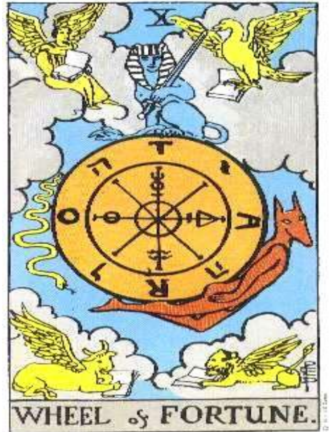
Ο ΤΡΟΧΟΣ ΤΗΣ ΤΥΧΗΣ – ΤΑΡΩ