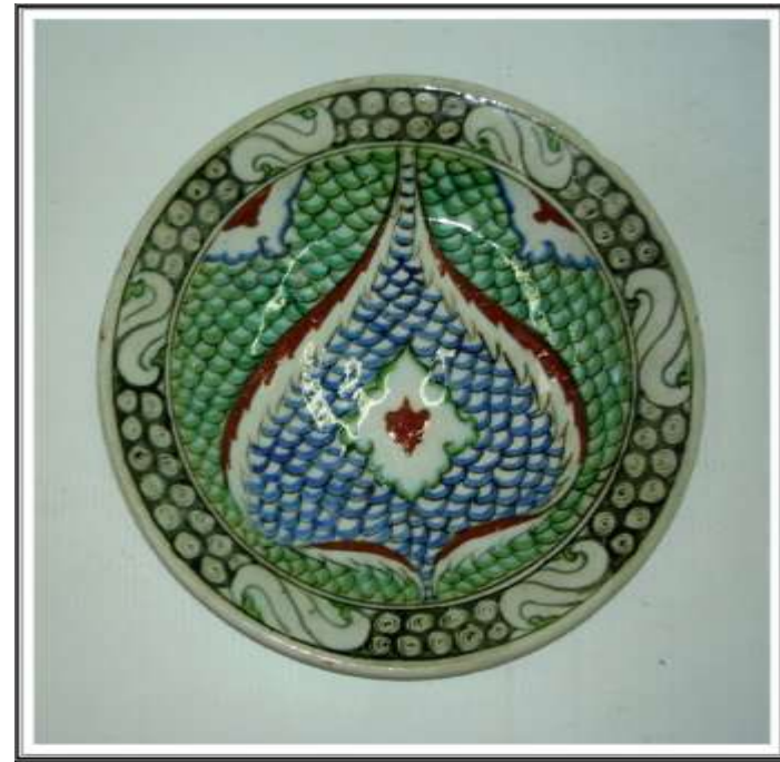
ΠΟΡΣΕΛΑΝΙΝΟ ΠΙΑΤΟ ΑΠΟ ΤΗΝ ΡΟΔΟ