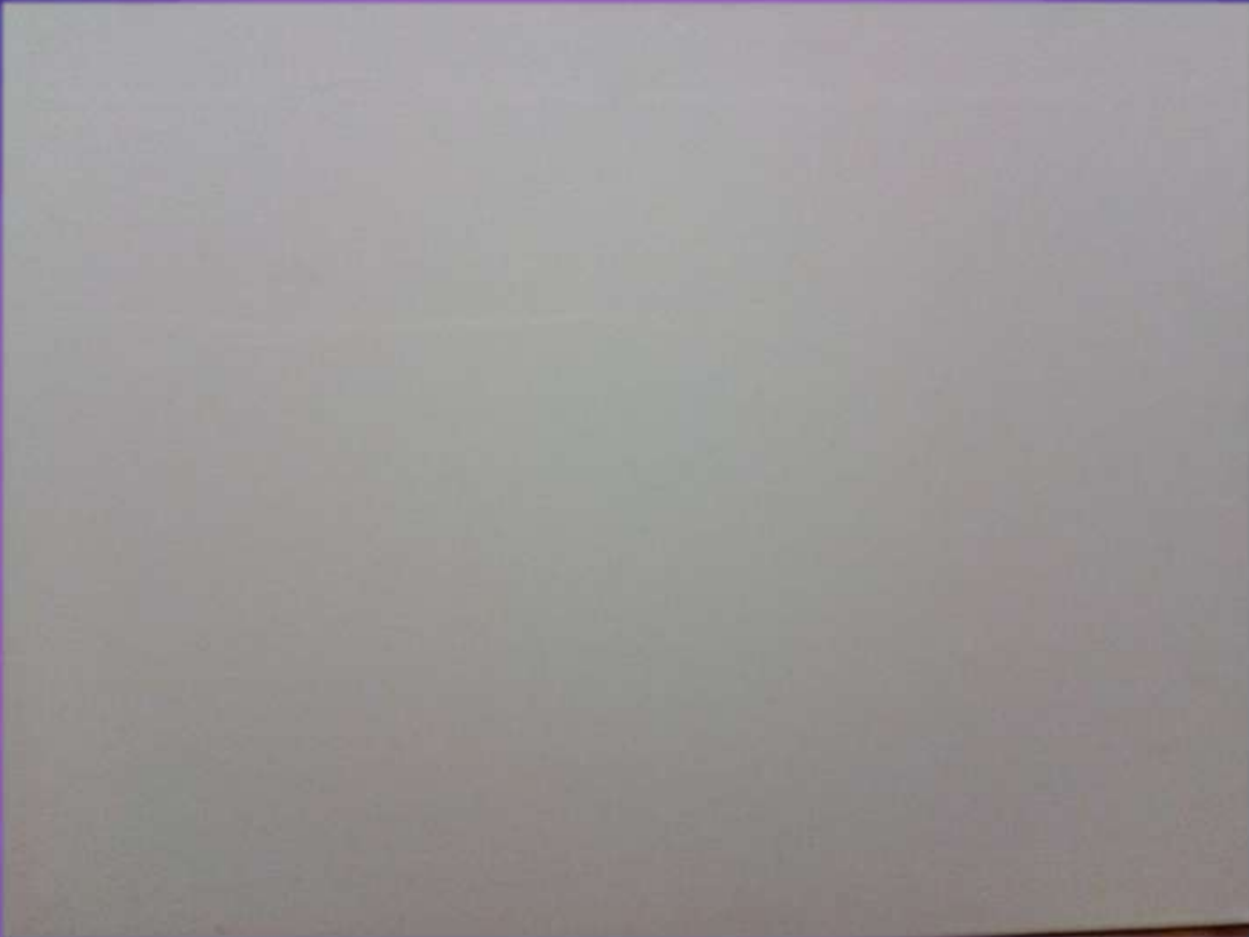
φωτο.1 Καμβάς βαμβακερός Luna 50x40 cm