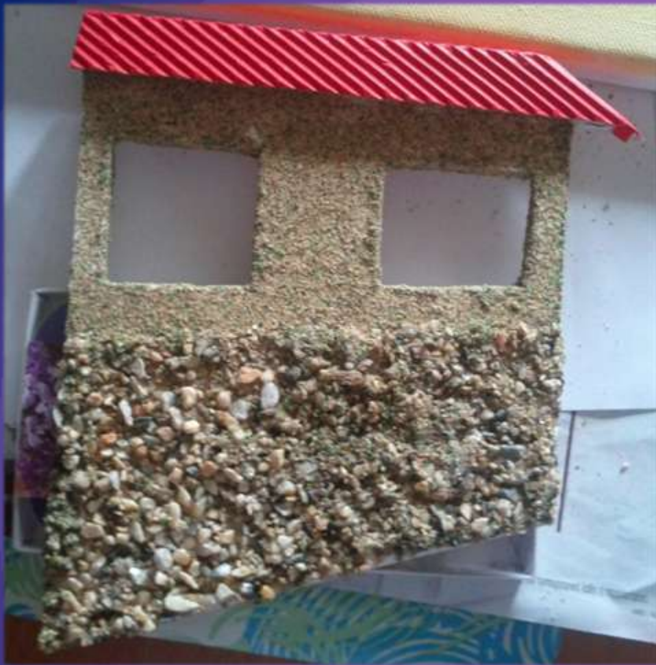
φωτο.28 τοποθέτηση στέγης.