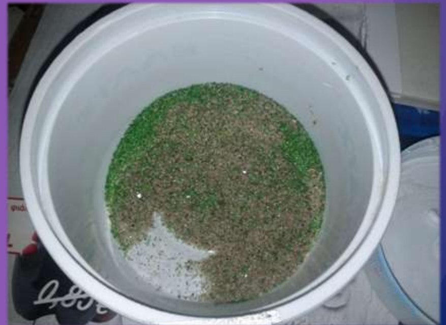
φωτο.25 κοσκινισμένη άμμο.