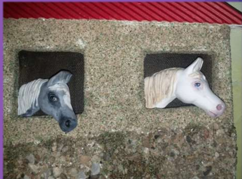
φωτο.33 τοποθέτηση αλόγων στα παράθυρα.