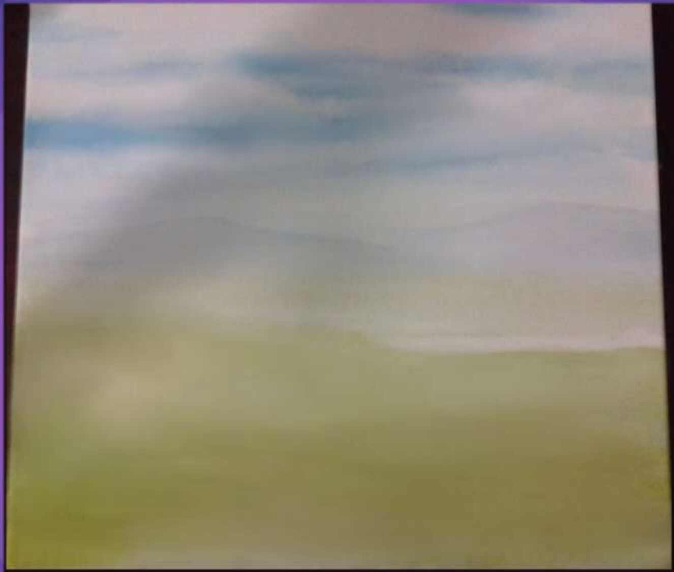
φωτο.2 Τα πρώτα χρώματα