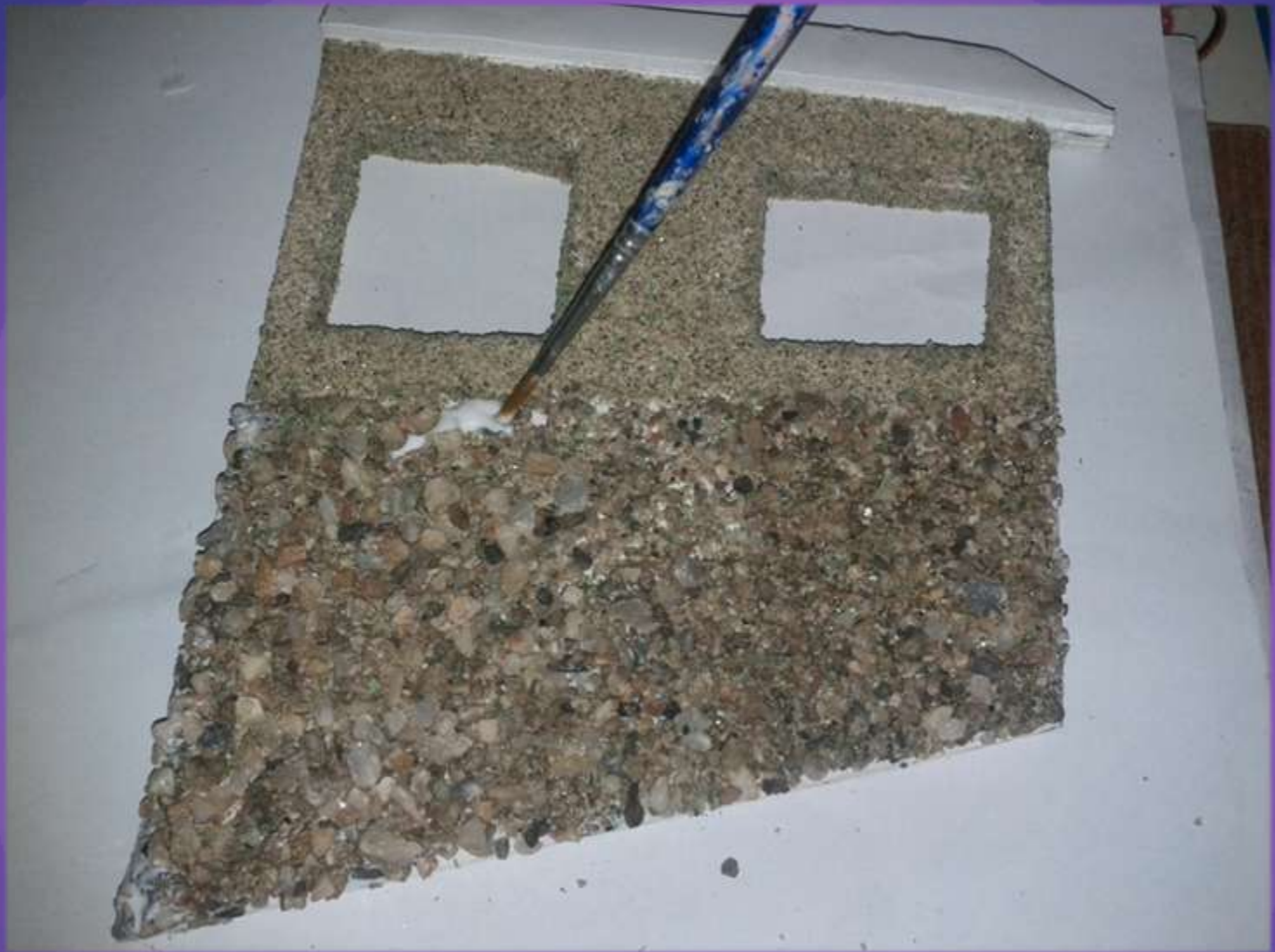
φωτο.27 κόλλημα πέτρας.