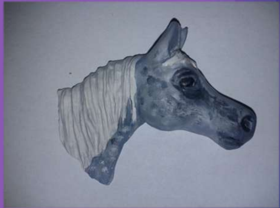
φωτο.16,17 dapple grey