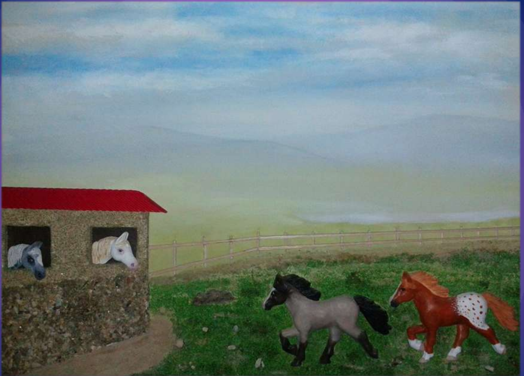
φωτο.35 Τελικό αποτέλεσμα.