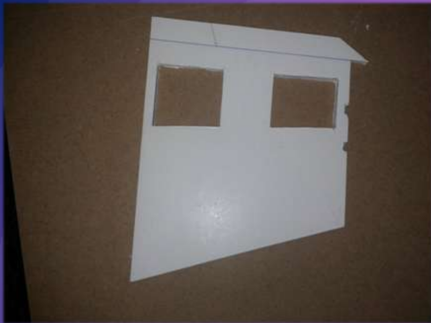
φωτο.22 κοπή μακετόχαρτου.