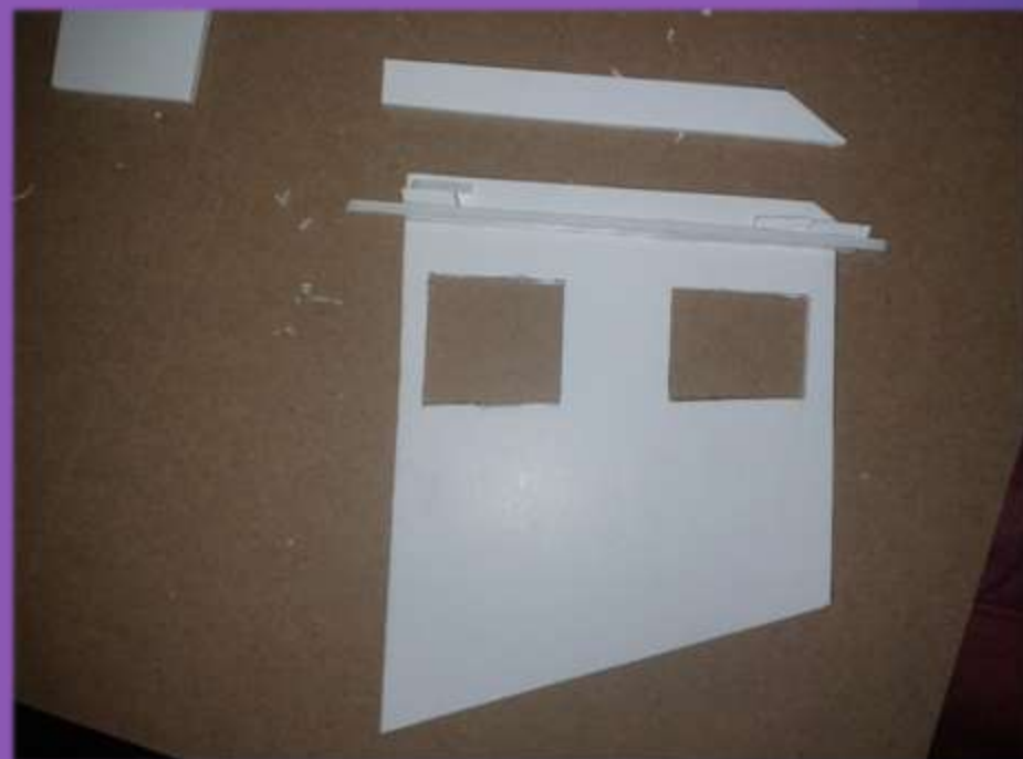
φωτο.23 φτιάξιμο στέγης.