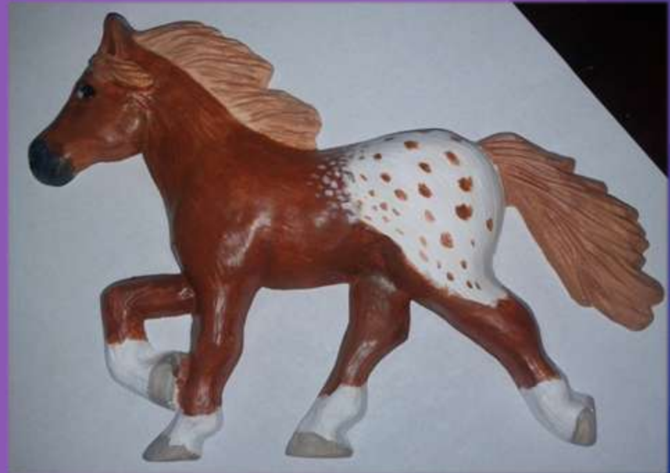
φωτο.11,12,13,14,15 chestnut spotted blanket