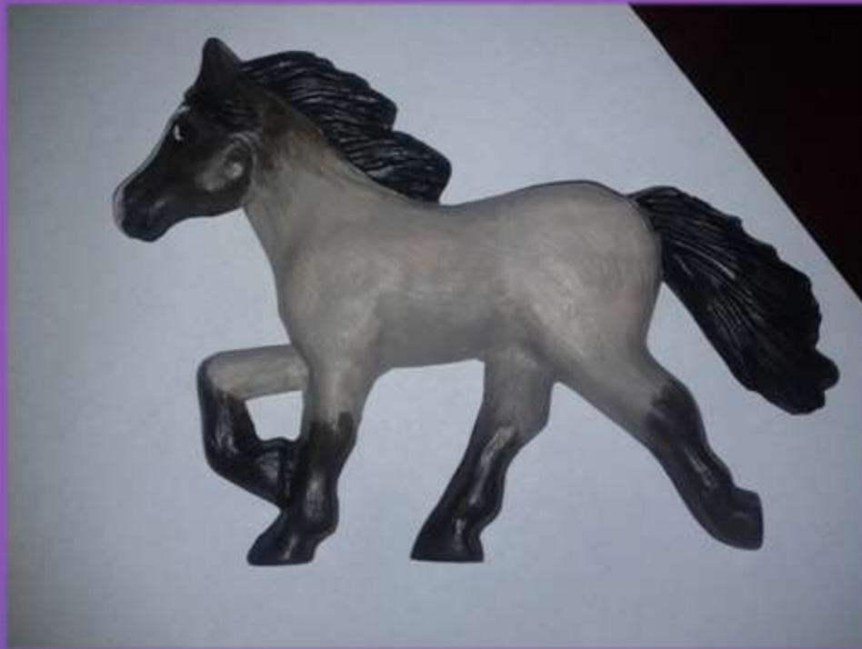
φωτο. 8,9,10 dark bay roan