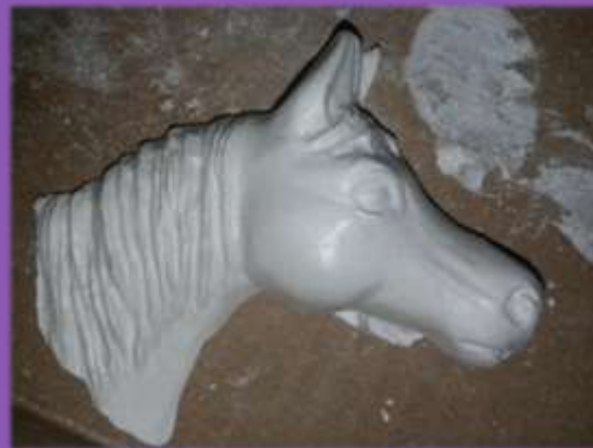
φωτο.3,4,5,6,7 Γύψινα άλογα στην αρχική τους μορφή.