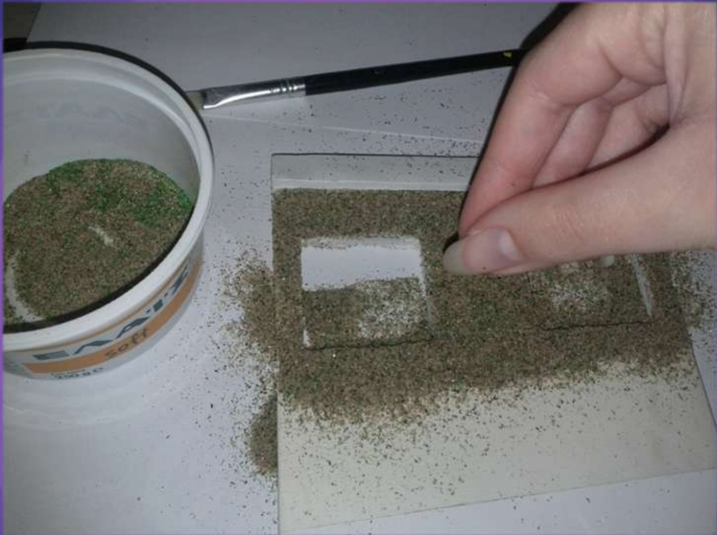
φωτο.26 κοσκινισμένη άμμο για να φαίνετε σουβάς.