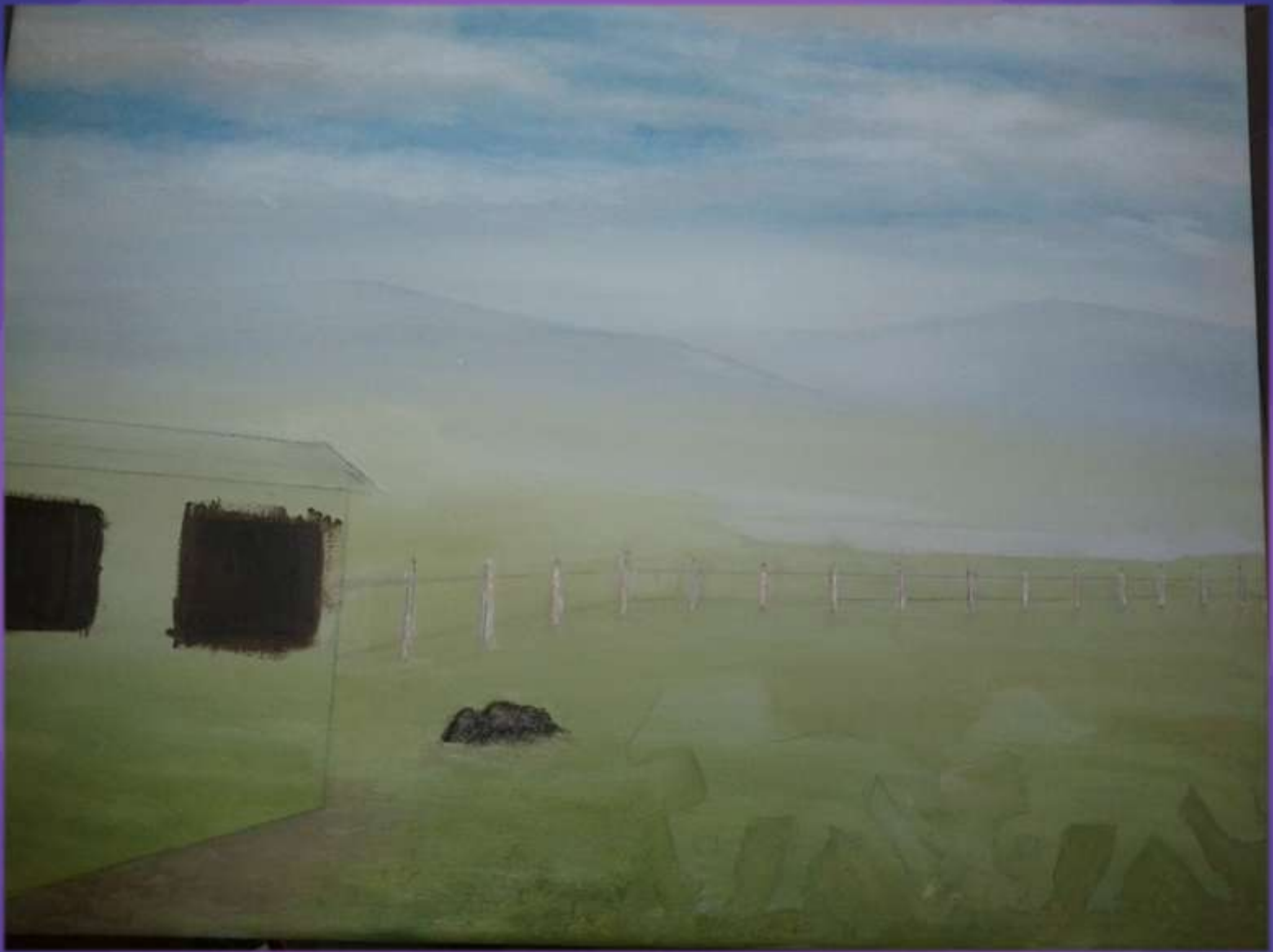
φωτο.30 βάψιμο παραθύρων, πέτρας και στο μέρος που έβαλα κόλλα