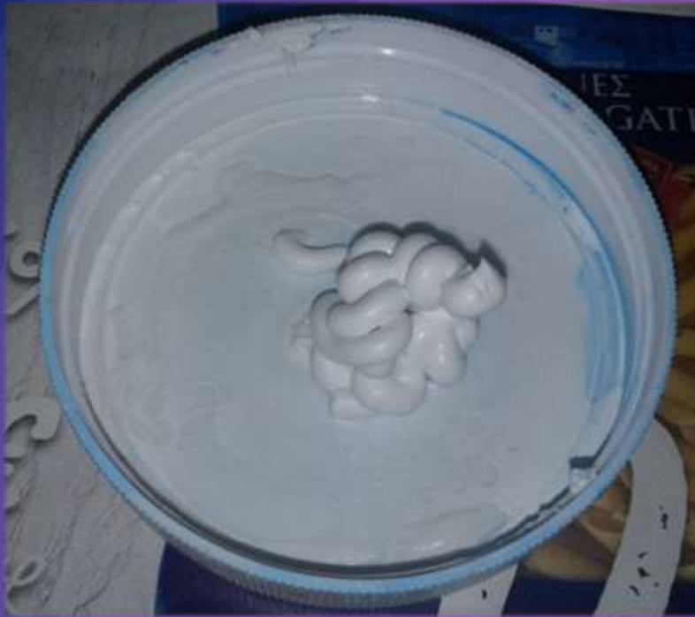
φωτο.24 κόλλα σιλικόνης.