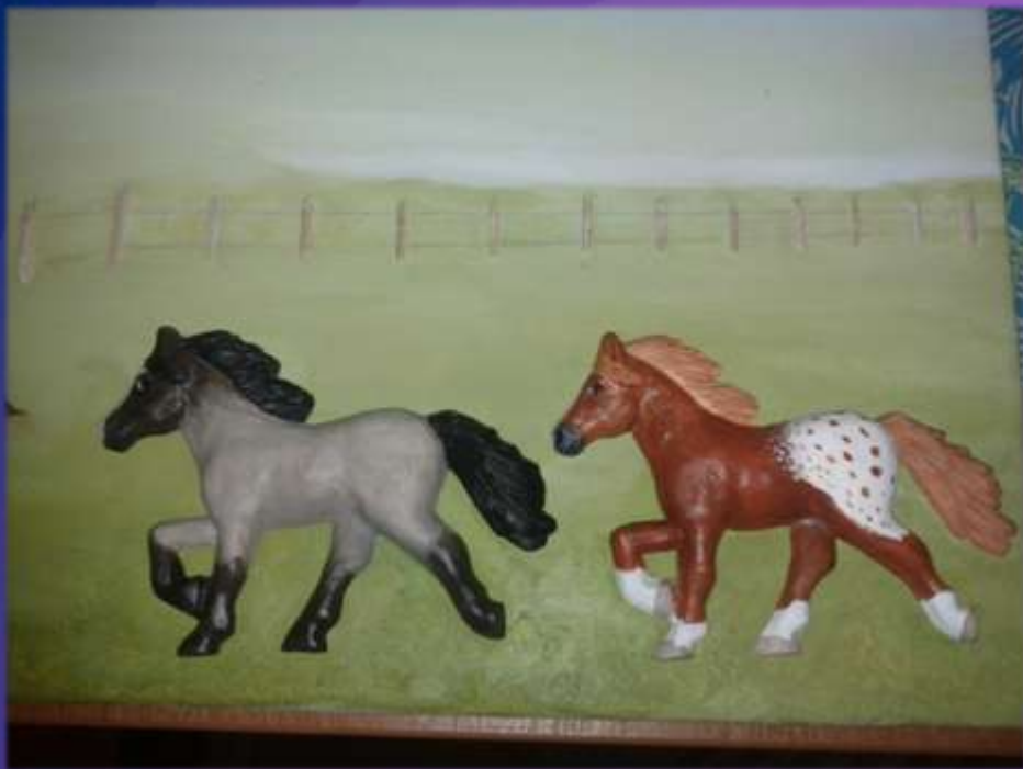
φωτο.32 τοποθέτηση αλόγων.