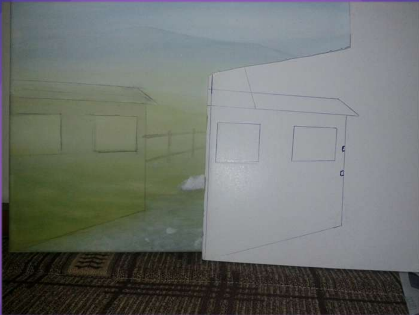
φωτο.21 σχεδίασμα του πατρών.