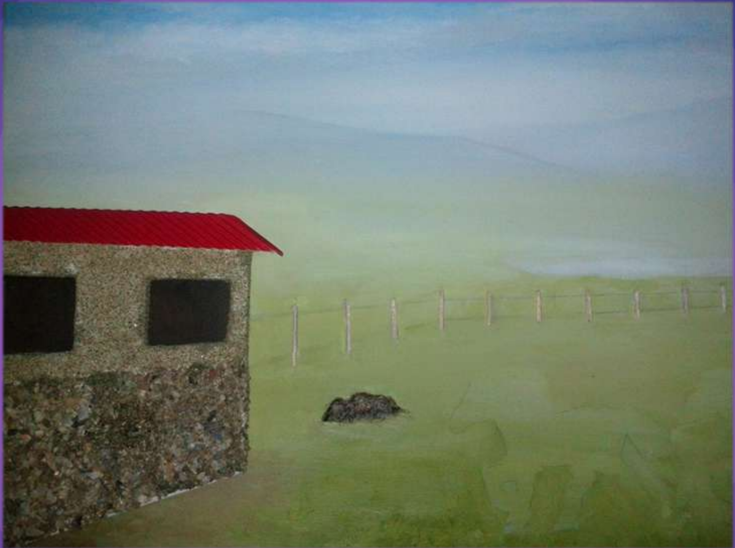
φωτο.31 κόλλημα στάβλου.