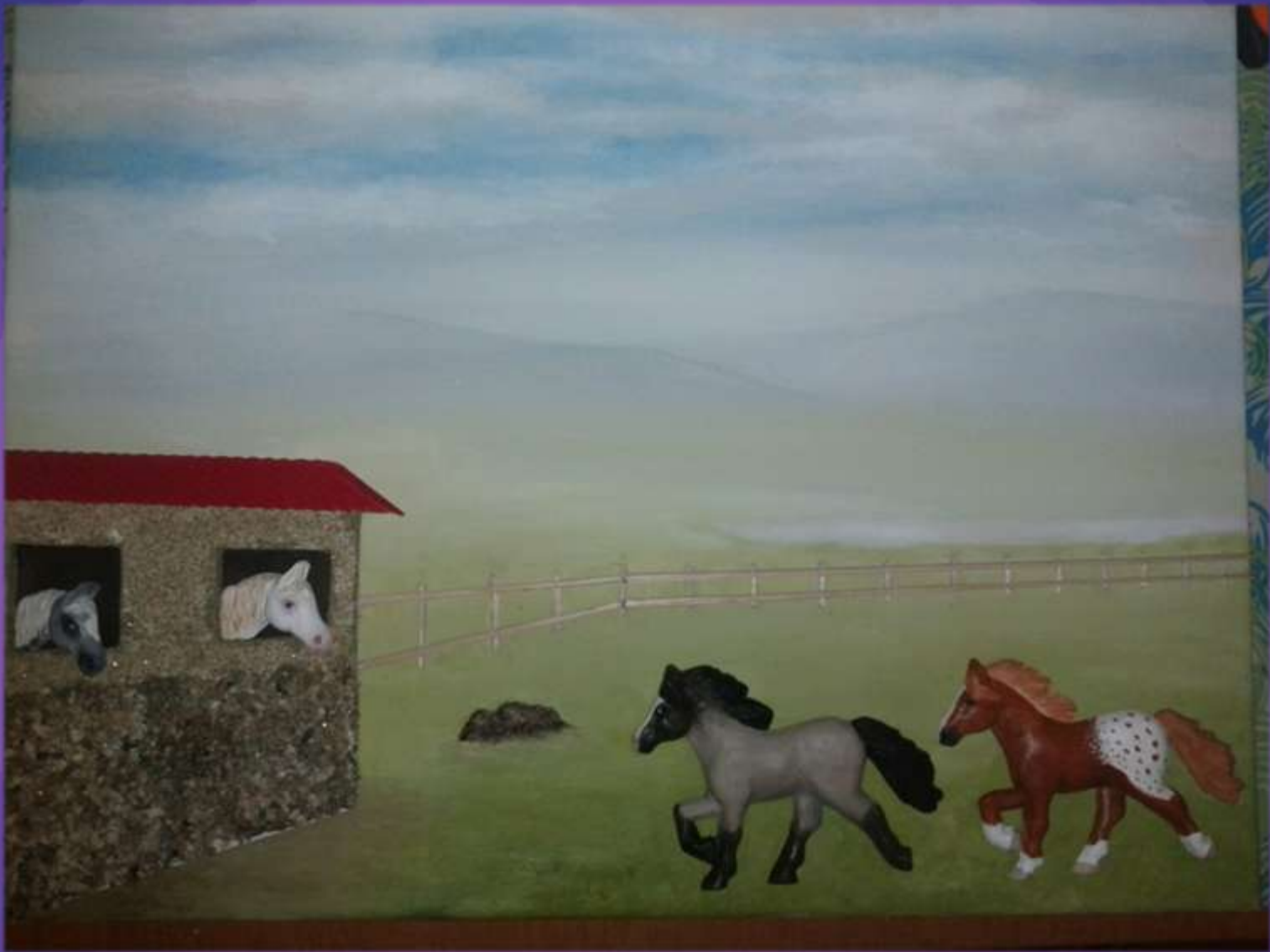
φωτο.34 ολοκλήρωση φράχτη.