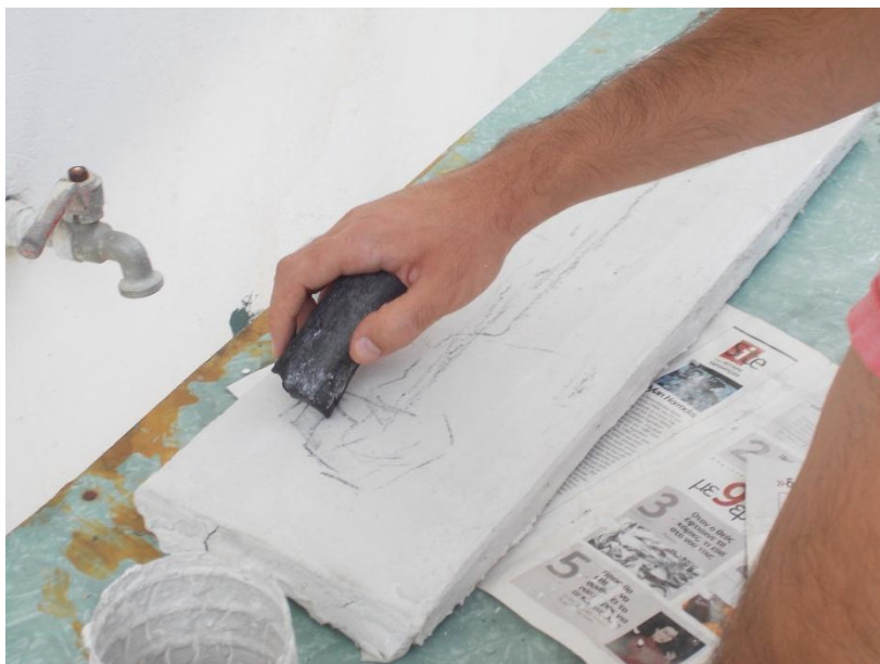
Εικ.33 διαστάσεις έργου: 59cm x 17cm

Με αφορμή τα υλικά που είχα επέλεξα σαν θέμα να ζωγραφίσω κάτι που να μοιάζει με πρωτόγονη τέχνη. Τα υλικά της καζείνης, της ντομάτας και της στάχτης μου θύμιζαν τις προϊστορικές τοιχογραφίες. Σκέφτηκα να σχεδιάσω ένα ζώο από τη φαντασία μου. Πήρα ένα κομματάκι από κάρβουνο 7 και άρχισα να σχεδιάζω το σχέδιο πάνω στη προετοιμασμένη επιφάνεια (Εικ.33).