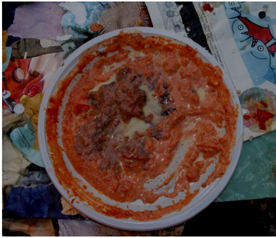
Εικ.42 Το εντονότερο κόκκινο