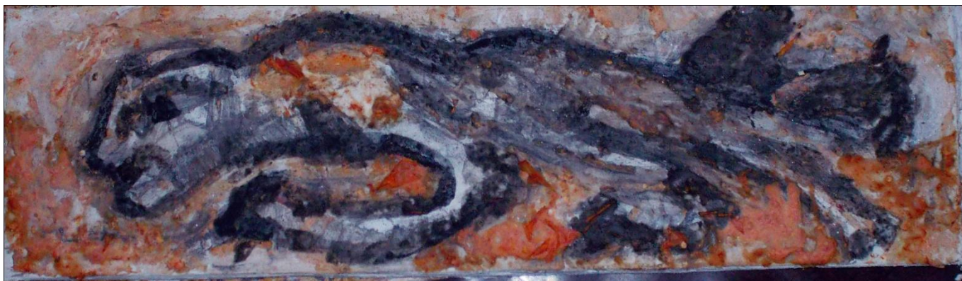
Εικ.46 Τελικό έργο, φυσικά υλικά, διαστάσεις: 59cm x 17cm, τίτλος έργου: Panthera palaeosinensis

κόλλας καζεΐνης και σταγόνες ξύδι. Χρησιμοποίησα το καθαρό κόκκινο με πινέλο σε σημεία που ήθελα να φαίνονται πιο έντονα. Τέλος χρησιμοποιώντας άσπρο χρώμα με το πινέλο τόνισα σημεία στη μορφή του ζώου που ήθελα να κάνω πιο ξεκάθαρα.