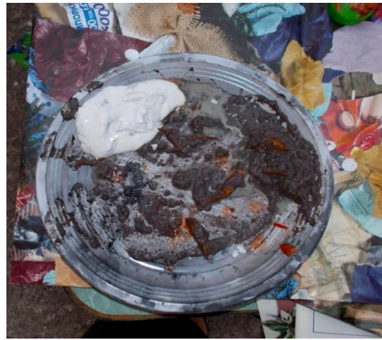
Εικ.43 Το ασπρο και το σκουρότερο κόκκινο