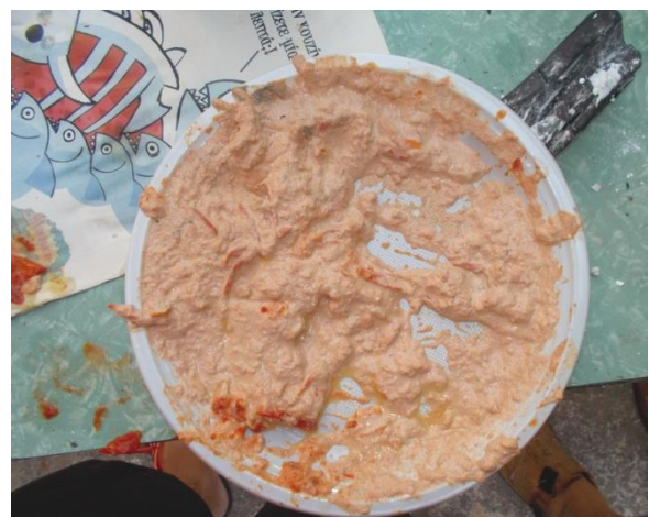
Εικ.41 Το ξασπρισμένο κόκκινο