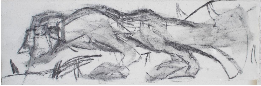
Εικ.34 Το σχέδιο ολοκληρωμένο, διαστάσεις: 59cm x 17cm

Μόλις ολοκλήρωσα το σχέδιο ξεκίνησα να φτιάχνω τη χρωματική παλέτα μου. Πρόσθεσα στις χρωστικές της ντομάτας και του κάρβουνου κόλλα καζεΐνης. Ανακάτεψα κάθε χρωστική με σπάτουλα προσθέτοντας σιγά σιγά λίγη ποσότητα κόλλας με το μάτι μέχρι να αποκτήσουν ενιαία υφή τα υλικά. Καθώς ανακάτεψα τη χρωστική της ντομάτας με τη κόλλα πρόσθεσα ελάχιστη ποσότητα ξυδιού σαν φυσικό συντηρητικό για καλύτερη διατήρηση στο χρόνο (Εικ.35). Για το άσπρο χρώμα χρησιμοποίησα ασβέστη 9 μαζί με μικρή ποσότητα κόλλας καζεΐνης.