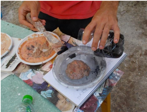
Εικ.38 Φωτογραφία κατά τη δημιουργία τριών ενδιάμεσων χρωματικών τόνων