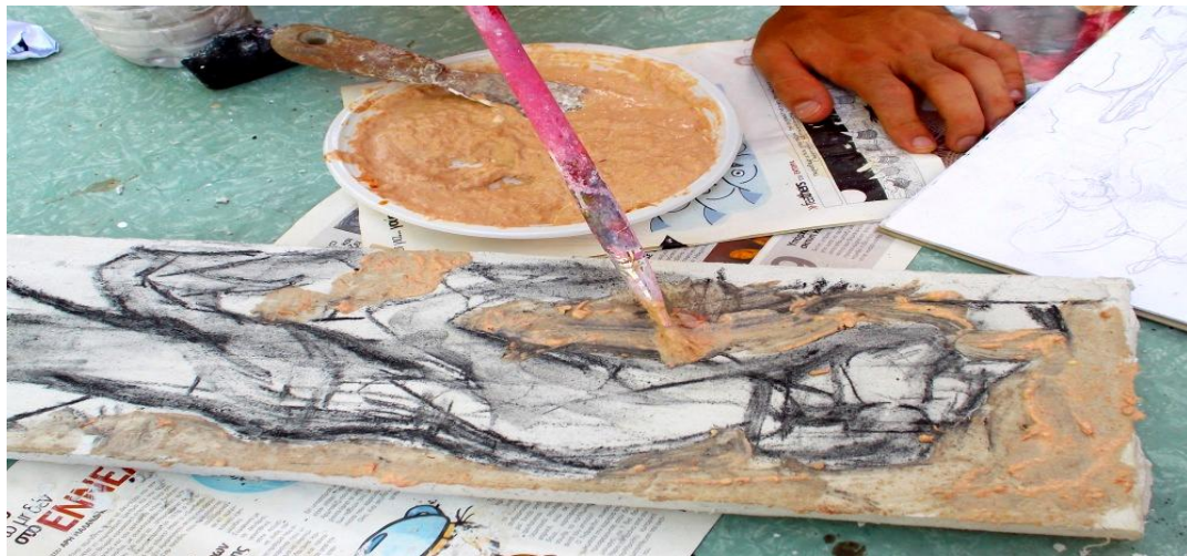
Εικ.44 διαστάσεις έργου: 59cm x 17cm

Στην αρχή με ένα πινέλο σε κάποια σημεία πέρασα υπό τη μορφή προπλασμού το ξασπρισμένο κόκκινο και το άφησα να στεγνώσει (Εικ.44). Σε μια ώρα περίπου αφού είχε στεγνώσει η επιφάνεια, με το εντονότερο κόκκινο πέρασα με μια σπάτουλα τα σημεία που ήθελα να τονίσω στο έργο υπό τη μορφή πάστας. Στη συνέχεια βάζοντας στο πινέλο μου μαύρο τόνισα το αρχικό σχέδιο που είχα κάνει με το κομμάτι του κάρβουνου. Σε σημεία που ήθελα να σκουρύνω έβαζα το σκουρότερο κόκκινο με σπάτουλα σε μορφή πάστας. Αφού άφησα ξανά το έργο κάποια ώρα για να στεγνώσει και να σταθεροποιηθεί έβαλα τις τελικές λεπτομέρειες. Πέρασα πολύ ντομάτας από σουρωτήρι πιέζοντας τη ντομάτα για να βγάλω καθαρό κόκκινο (Εικ.45). Στο καθαρό κόκκινο πρόσθεσα μικρή ποσότητα