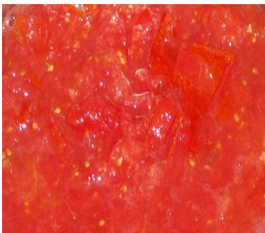
Εικ.40 Η χρωστική κόκκινου