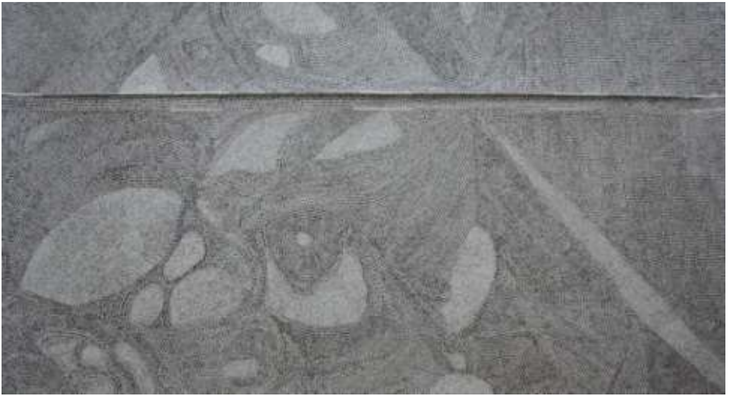
Εικόνα 9 Τοπίο 2 , 137 x 85 εκ. , μελάνι σε χαρτί