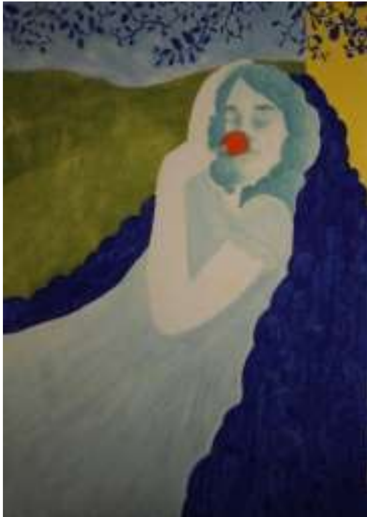
Εικόνα 13 Λουλούδι , 60 x 85 εκ. , λάδι σε χαρτί

Ένα μέτρο, μια αξία βρίσκεται, με αφορμή το λουλούδι, μέσα σε αυτή την κτηνωδία. Το κορίτσι με απλά ερεθίσματα παρασύρεται και ταξιδεύει είτε αυτό είναι το άρωμα ενός λουλουδιού είτε είναι ένα κεράσι μέχρι που στο τέλος την παίρνει γλυκά ο ύπνος και ένα όνειρο αρχίζει να ξεπροβάλλει.