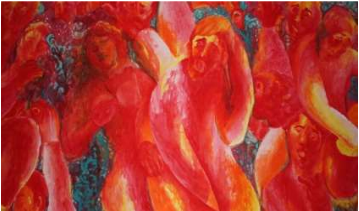
Εικόνα 4 Βόμβες ναπάλμ 2 , 137 x 85 εκ. , λάδι σε χαρτί