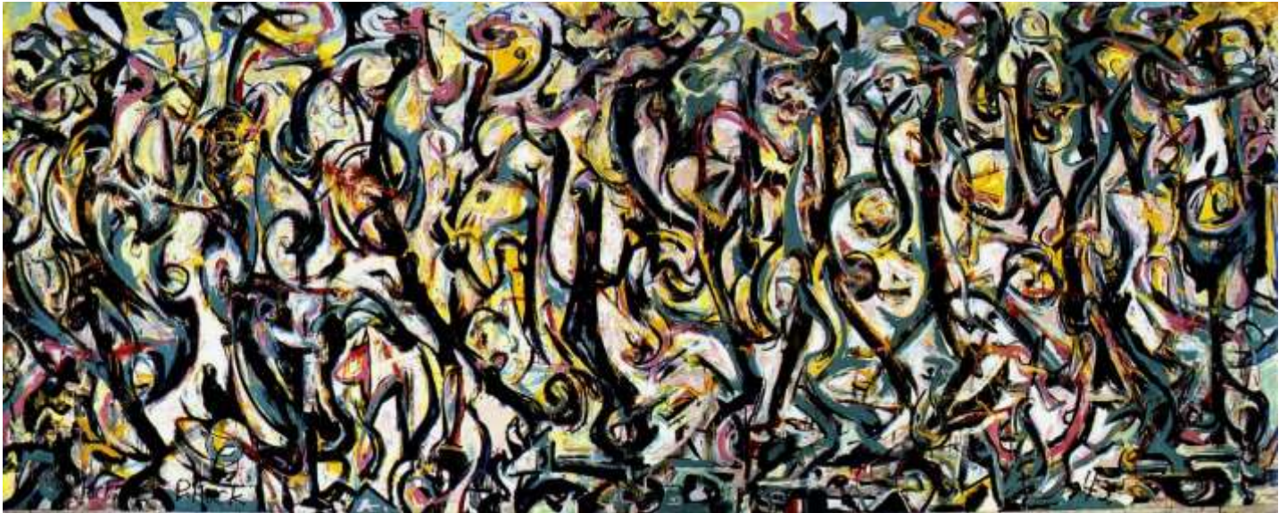
Εικόνα 1 Τζάκσον Πόλοκ , Mural , 247x605 εκ., λάδι σε καμβά, University of Iowa Museum of Art, 1943

Προσπάθησα να δώσω πρωταρχικό ρόλο στο χρώμα και στην ροή του με βασική αναφορά την τοιχογραφία του Τζάκσον Πόλοκ ( Jackson Pollock)