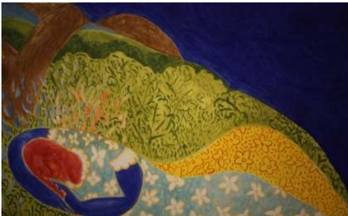
Εικόνα 15 Ο υπνάκος , 137 x 85 εκ. , λάδι σε χαρτί