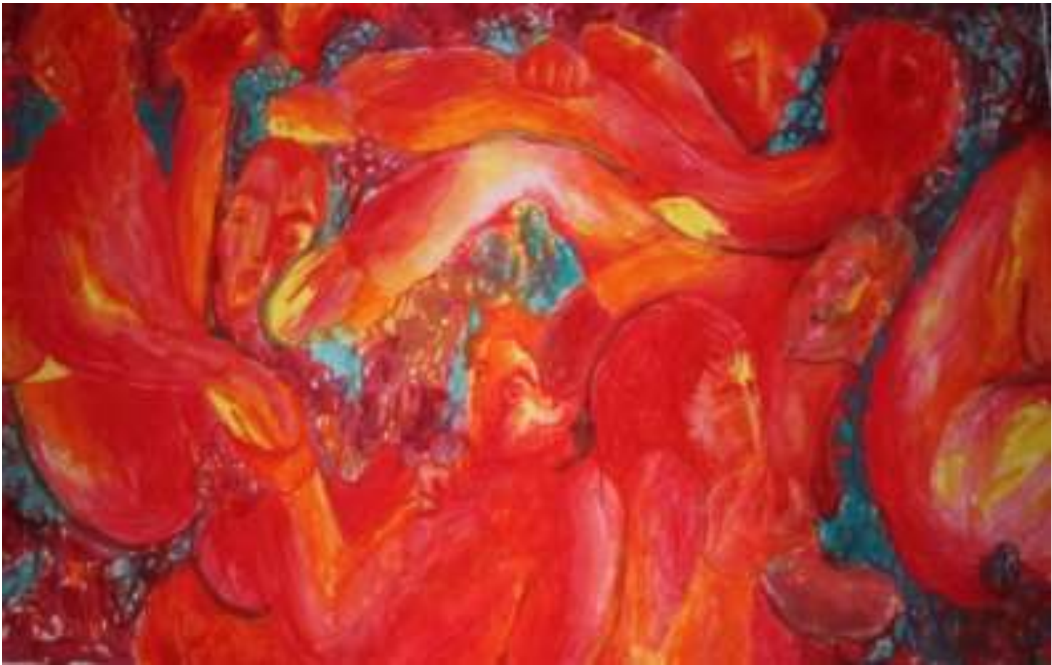
Εικόνα 3 Βόμβες ναπάλμ 1 , 137 x 85 εκ. , λάδι σε χαρτί