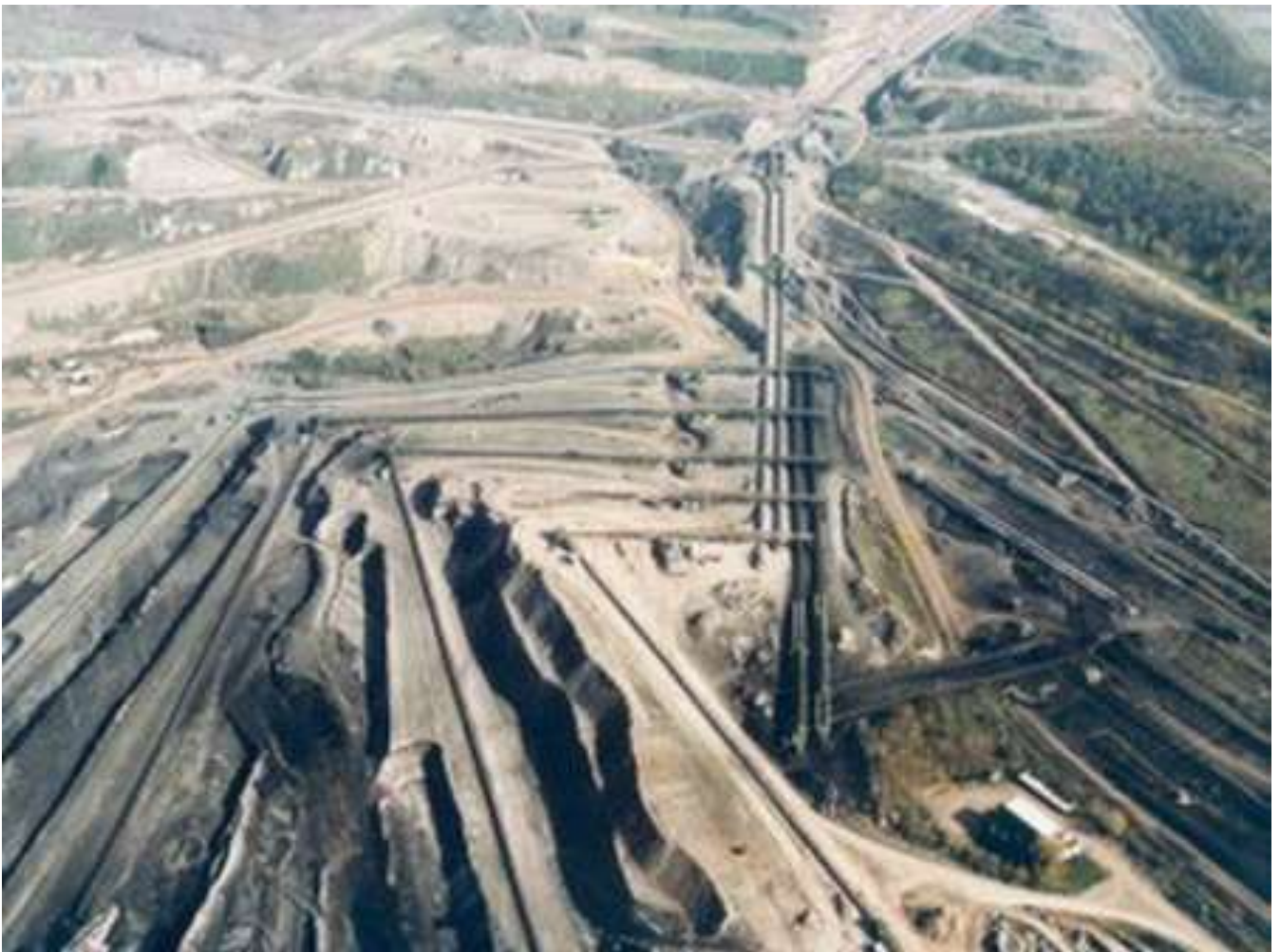
Τοπίο της ΔΕΗ από την Πτολεμαίδα

Η ΔΕΗ συστάθηκε με χρηματοδότηση μέσω του σχεδίου Μάρσαλ και αποτελεί μέχρι και σήμερα την κύρια πηγή παροχής ηλεκτρικής ενέργειας στη χώρα. Έχει εξαπλωθεί στην γύρω περιοχή με τρομακτική ασυδοσία και αποτελεί χαρακτηριστικό παράδειγμα επιχείρησης που απομυζεί τόσο το περιβάλλον όσο και τους εργαζόμενους της.