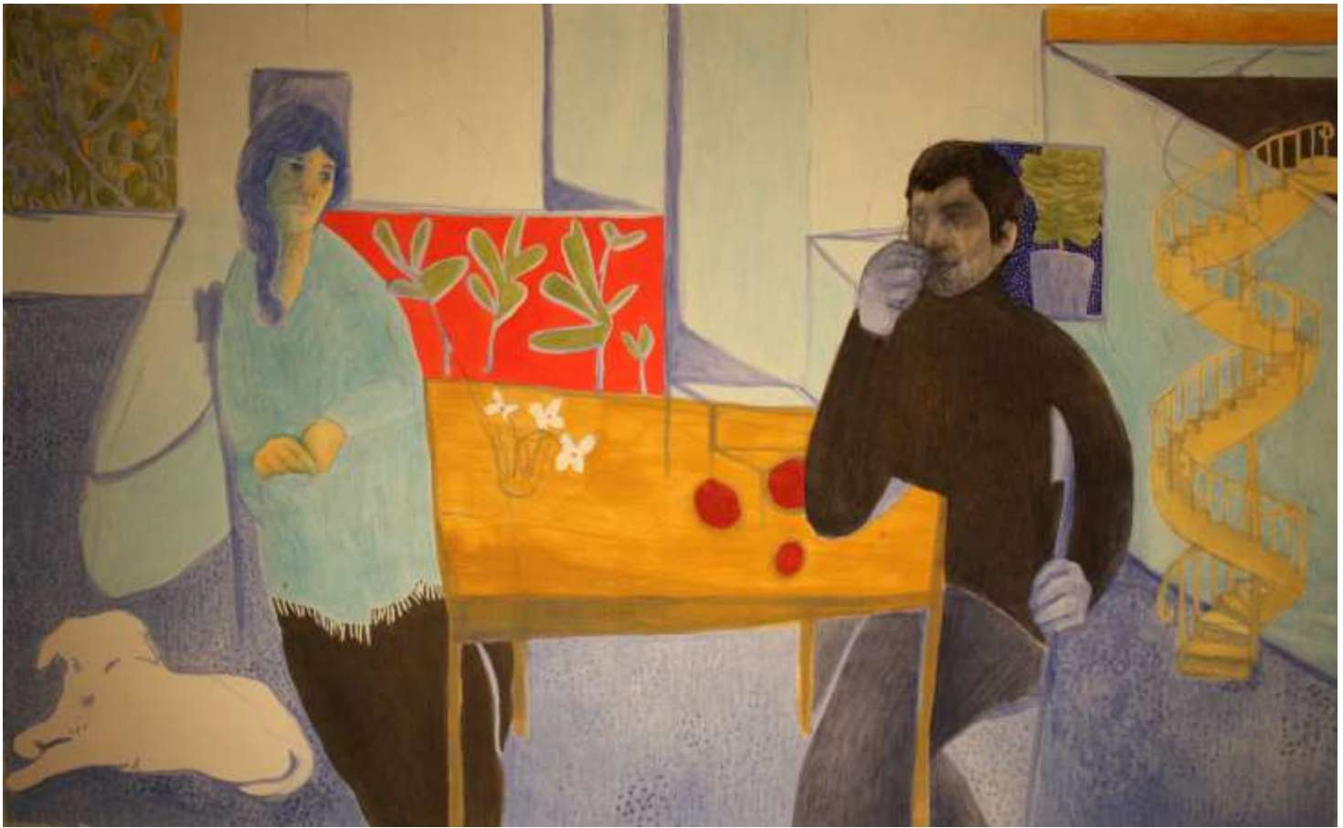
Εικόνα 17 Απογευματινό τσιπουράκι, 137 x 85 εκ. , λάδι σε χαρτί