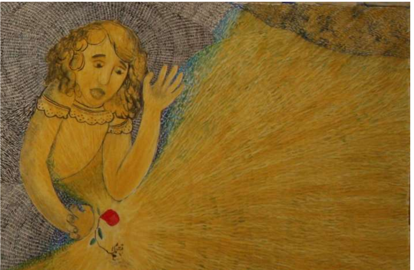
Εικόνα 12 λεπτομέρεια από το έργο Φως, 214 x 85 εκ. , μελάνι και λάδι σε χαρτί