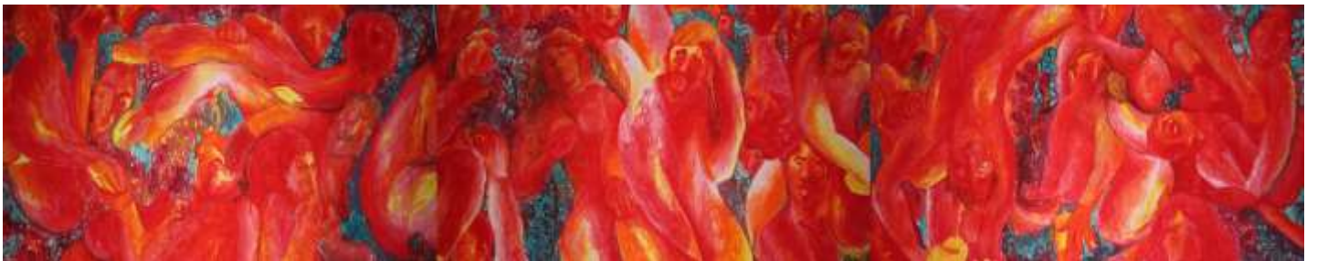
Εικόνα 2 Βόμβες ναπάλμ 1,2,3, 137 x 85 εκ. , λάδι σε χαρτί