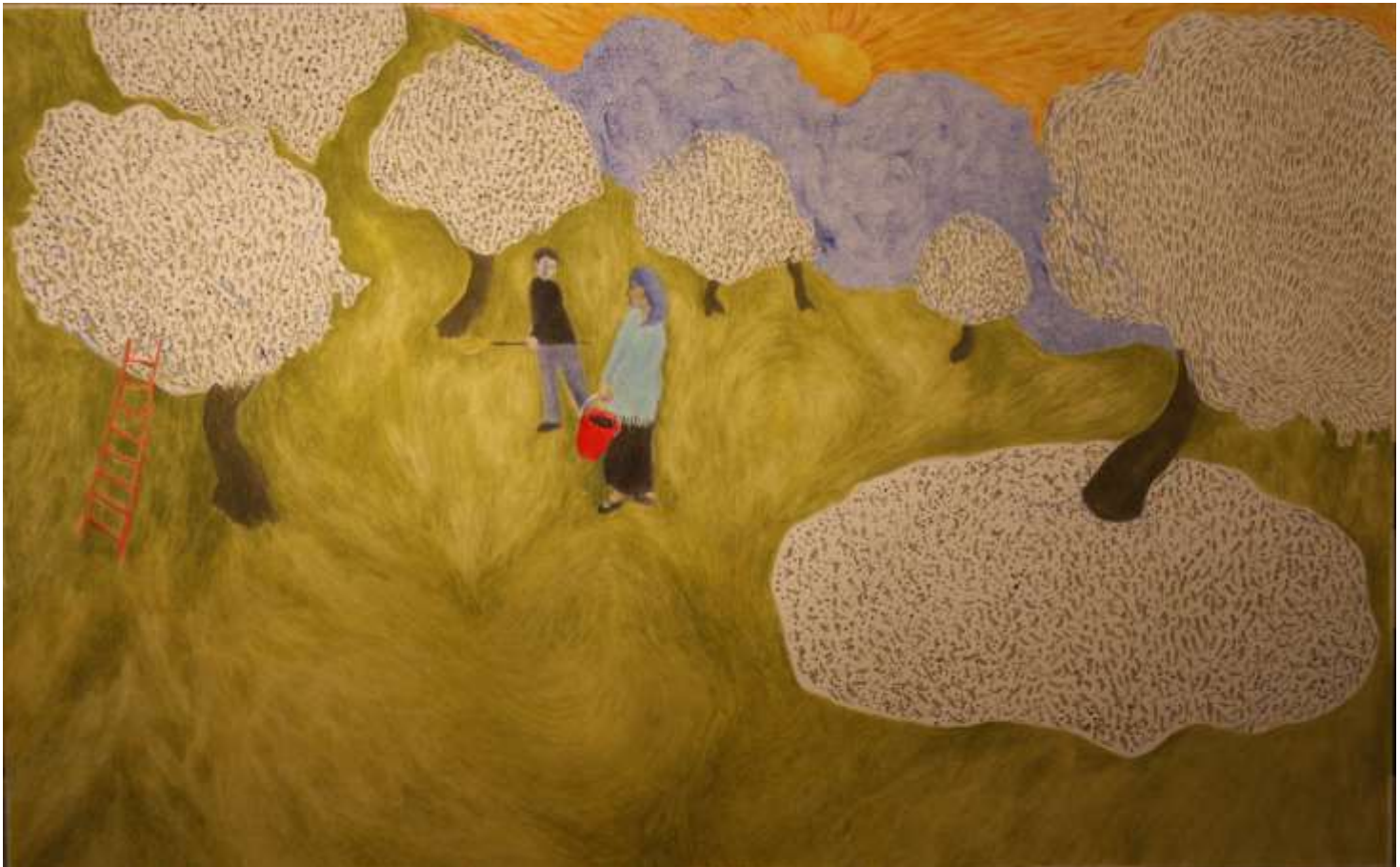
Εικόνα 16 Μάζεμα ελιών , 137 x 85 εκ. , λάδι σε χαρτί

Το κορίτσι ονειρεύεται δύο καλούς της φίλους που είναι ζευγάρι, να μαζεύουν ελιές, να πίνουν το απογευματινό τους τσιπουράκι και να ονειρεύονται με τη σειρά τους το βράδυ, ψηλά πάνω απ' το χωριό.