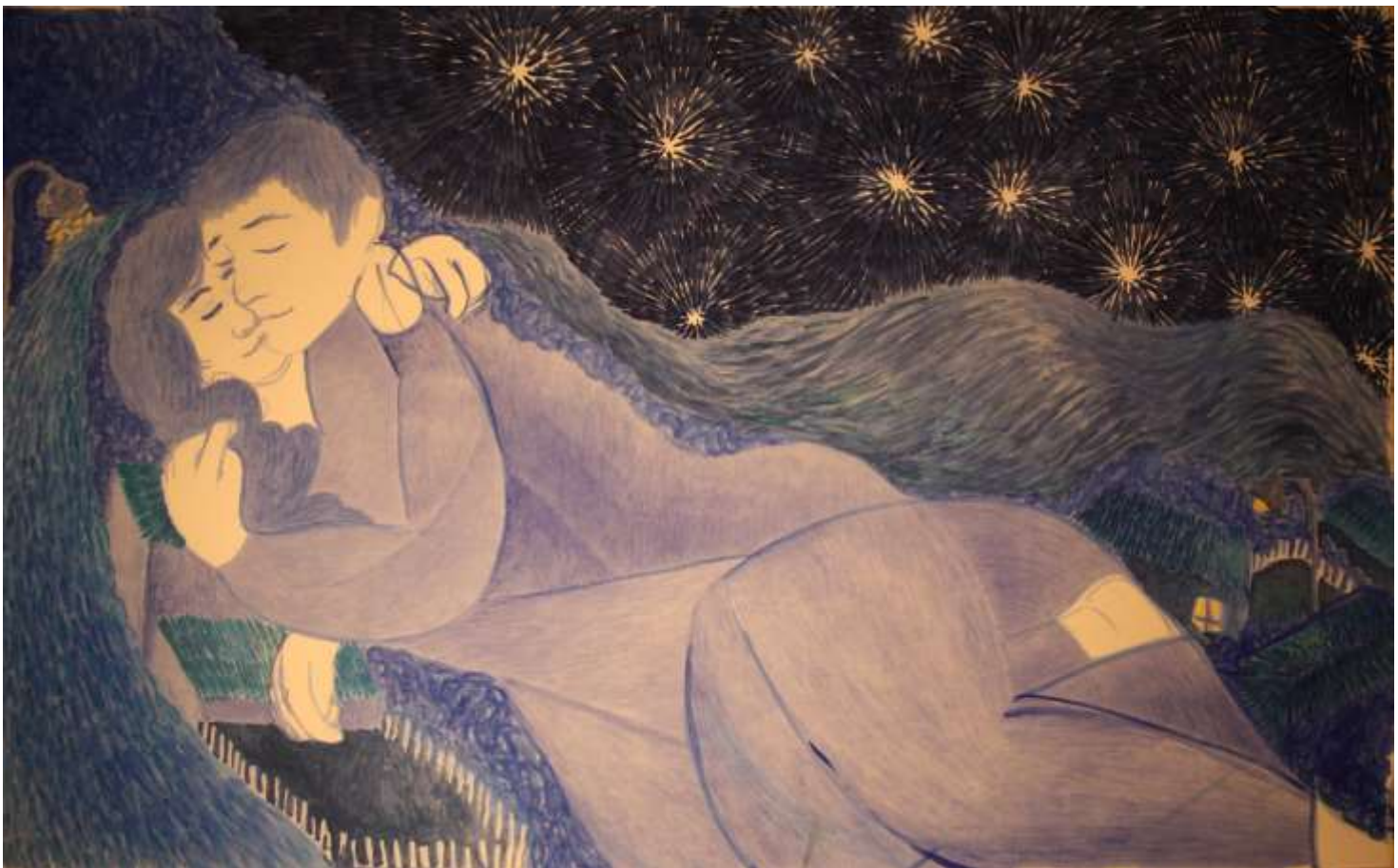
Εικόνα 18 Αγκαλίτσες πάνω απ' το χωριό, 137 x 85 εκ. , λάδι σε χαρτί