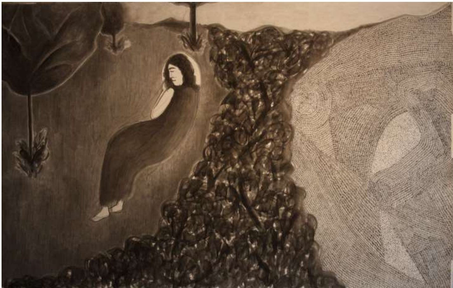
Εικόνα 19 Back to reality , 137 x 85 εκ. , μελάνι και λάδι σε χαρτί

Ποτέ δεν υπήρξε πράσινο, ποτέ τα κεράσια δεν ήταν κόκκινα. Κουρνιάζει και ονειρεύεται στα τελευταία ψήγματα γης που δεν έχουν ακόμα ερημοποιηθεί. Όπως μπορεί κι αυτή για να μην από τώρα τρελαθεί.