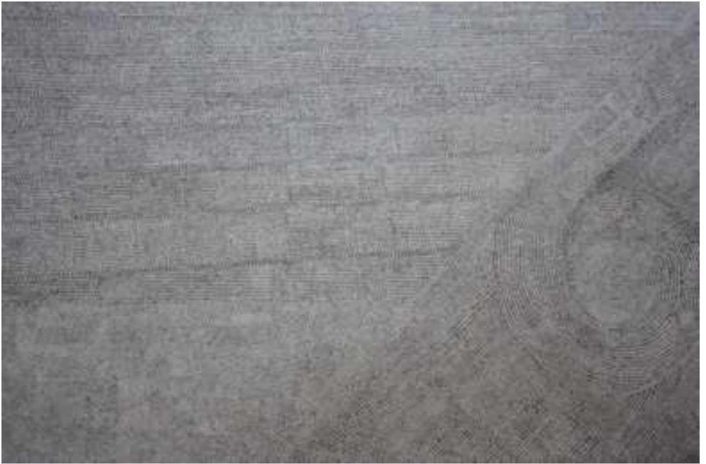
Εικόνα 8 Τοπίο 1, 137 x 85 εκ. , μελάνι σε χαρτί

Το αρχικό τοπίο της Πτολεμαΐδας που έχει ουσιαστικά καταστραφεί αποτέλεσε για μένα το κύριο στοιχείο αυτής της σειράς. Βρισκόμενος μέσα σε αυτές τις απέραντες και αχανείς εκτάσεις ένα αίσθημα δέους σε κατακλύζει. Ένα αίσθημα δέους όμως που προκύπτει από το τίποτα, από το μηδέν που έχει κατακλύσει τα πάντα. Γι αυτό και εγώ χρησιμοποίησα μία διαφορετική εικαστική προσέγγιση. Διάλεξα να αποδώσω αυτό το τίποτα με την γραμμούλα. Το πλέον απλό και βασικό στοιχείο που αναπαραγόμενο πολλές φορές σου δίνει κάτι-τίποτα.