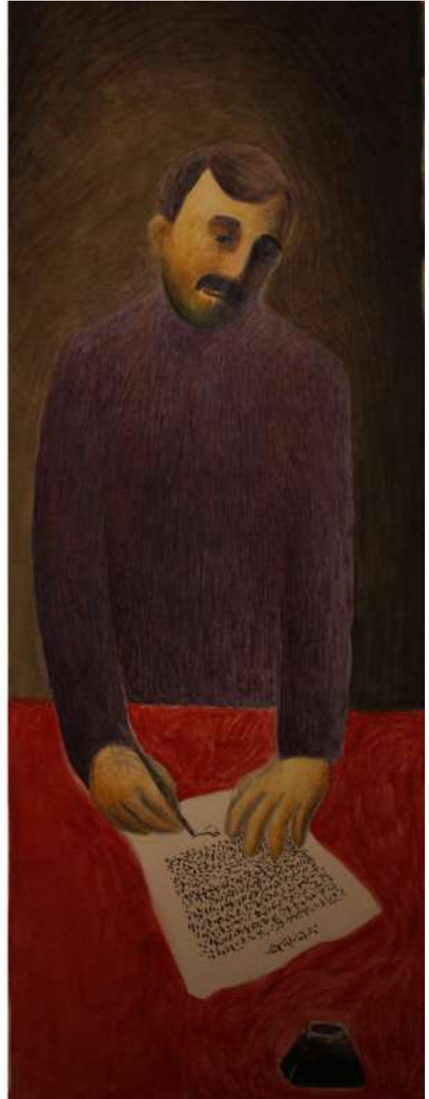
Εικόνα 7 Σοφούλης, 137 x 47, λάδι σε χαρτί