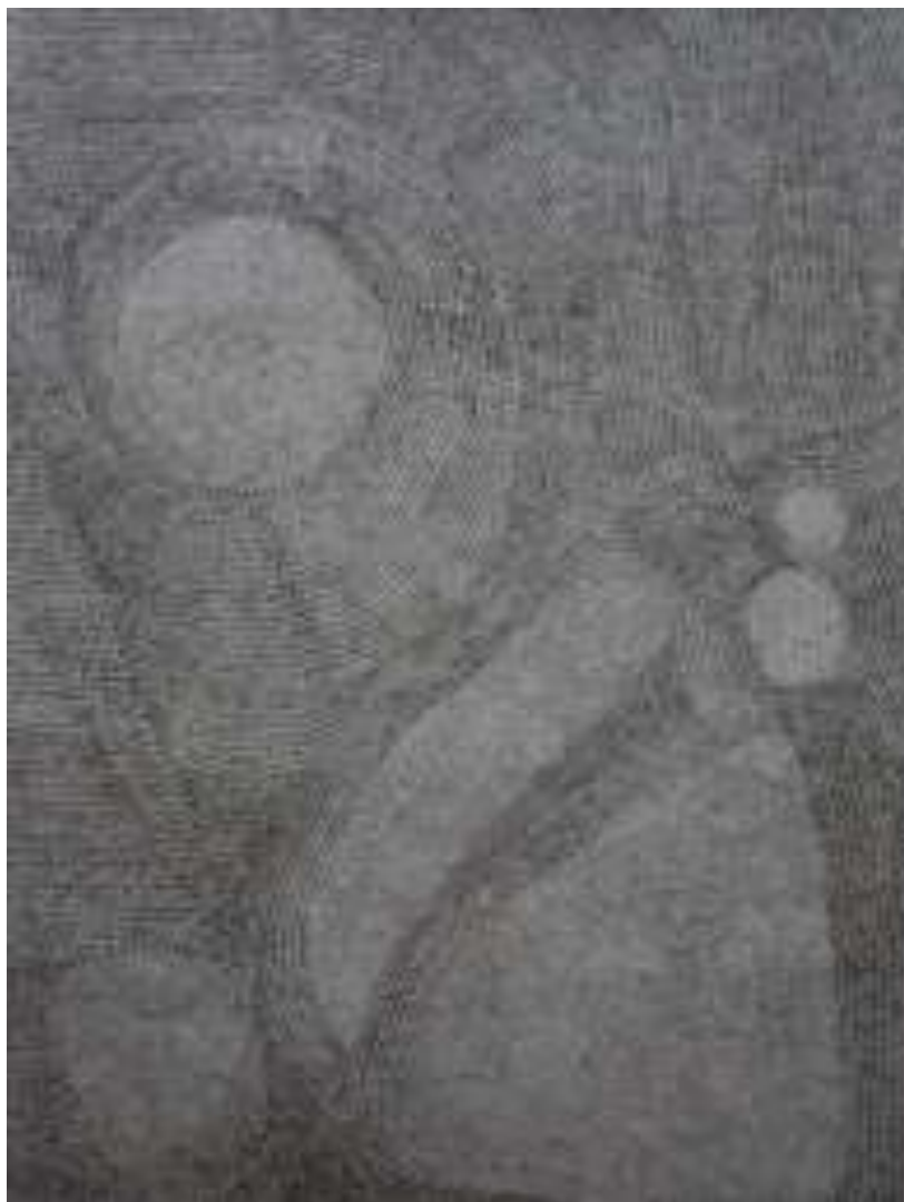
Εικόνα 10 Τοπίο 3 , 60 x 85 εκ. , μελάνι σε χαρτί