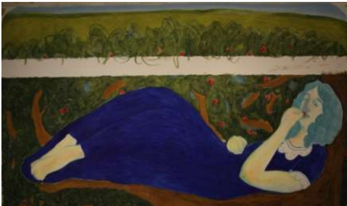
Εικόνα 14 Κεράσια , 137 x 55 και 137 x 20 εκ. , λάδι σε χαρτί