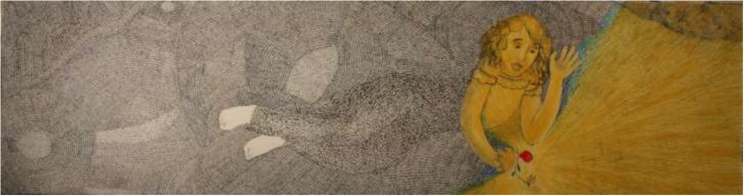
Εικόνα 11 Φως, 214 x 85 εκ. , μελάνι και λάδι σε χαρτί

Ότι φωτίζει η Θεία χάρη της φύσης παύει να είναι μια στείρα έρημος, παύει να είναι γραμμούλα.