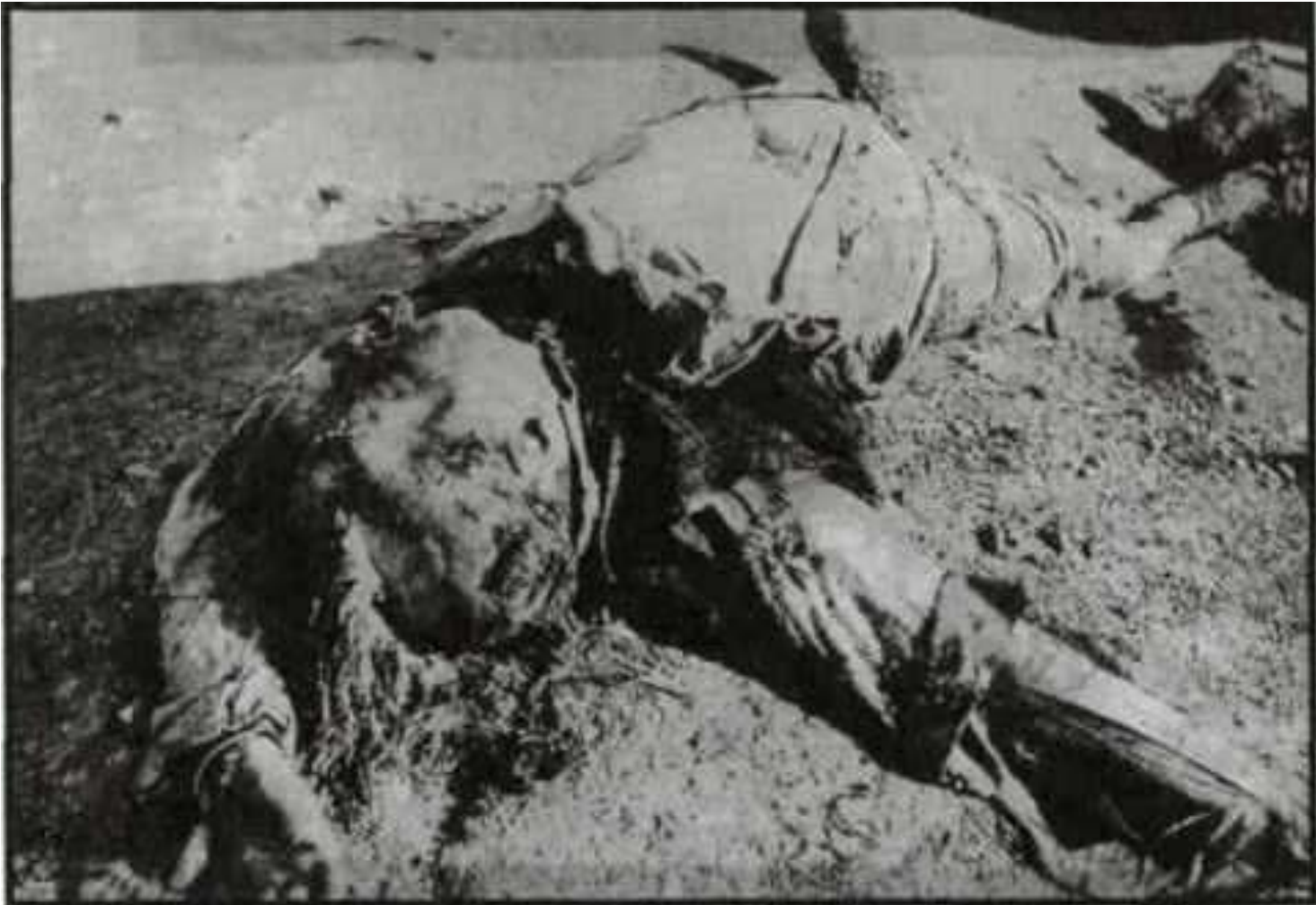
Νεκρός από ναπάλμ στον Γράμμο

Στον Γράμμο οι βόμβες ναπάλμ χρησιμοποιήθηκαν για πρώτη φορά το 1948 κατά την επιχείρηση των 70 ημερών του ΕΣ στον Γράμμο. Αμερικανικού τύπου αεροσκάφη χτύπησαν σε πολλά σημεία την οροσειρά με την εξελιγμένη μορφή της βόμβας ναπάλμ, την war para1m-B. Η ελληνική στρατιωτική διοίκηση του ΕΣ με χαρά έλαβε τα νέα για το αποτέλεσμα του νέου όπλου που θα καθάριζε όπως πίστευαν ολοκληρωτικά τις πλαγιές από τους αντάρτες. Από την δική τους μεριά οι αντάρτες είδαν με δέος ένα από τα ισχυρότερα όπλα της εποχής να " βρέχει φωτιά" πάνω από τις θέσεις τους. 1