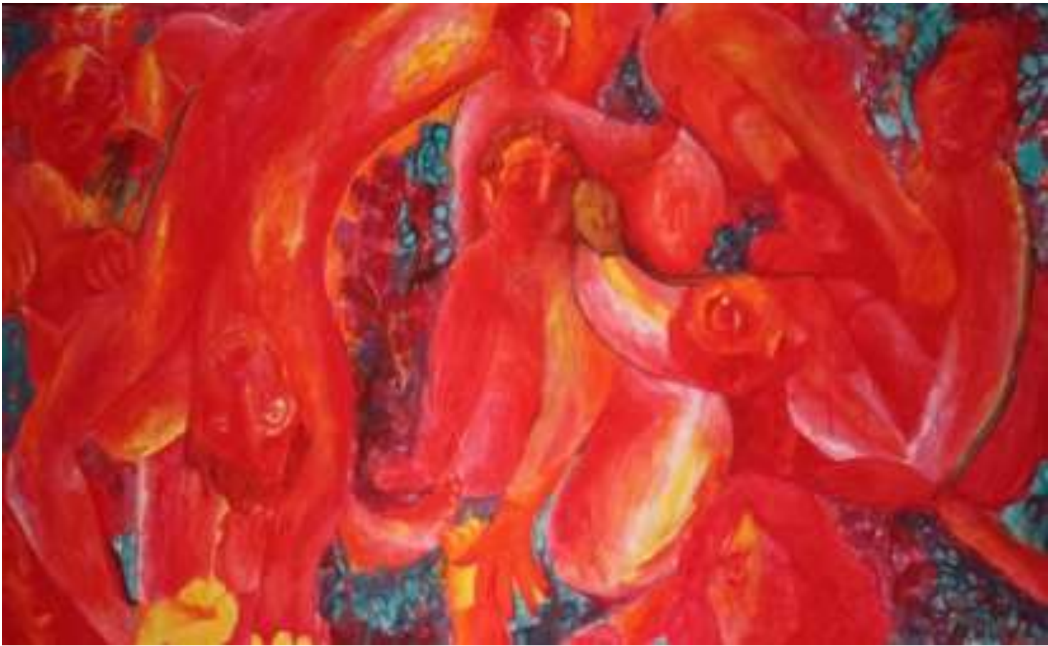
Εικόνα 5 Βόμβες ναπάμ 3 , 137 x 85 εκ. , λάδι σε χαρτί