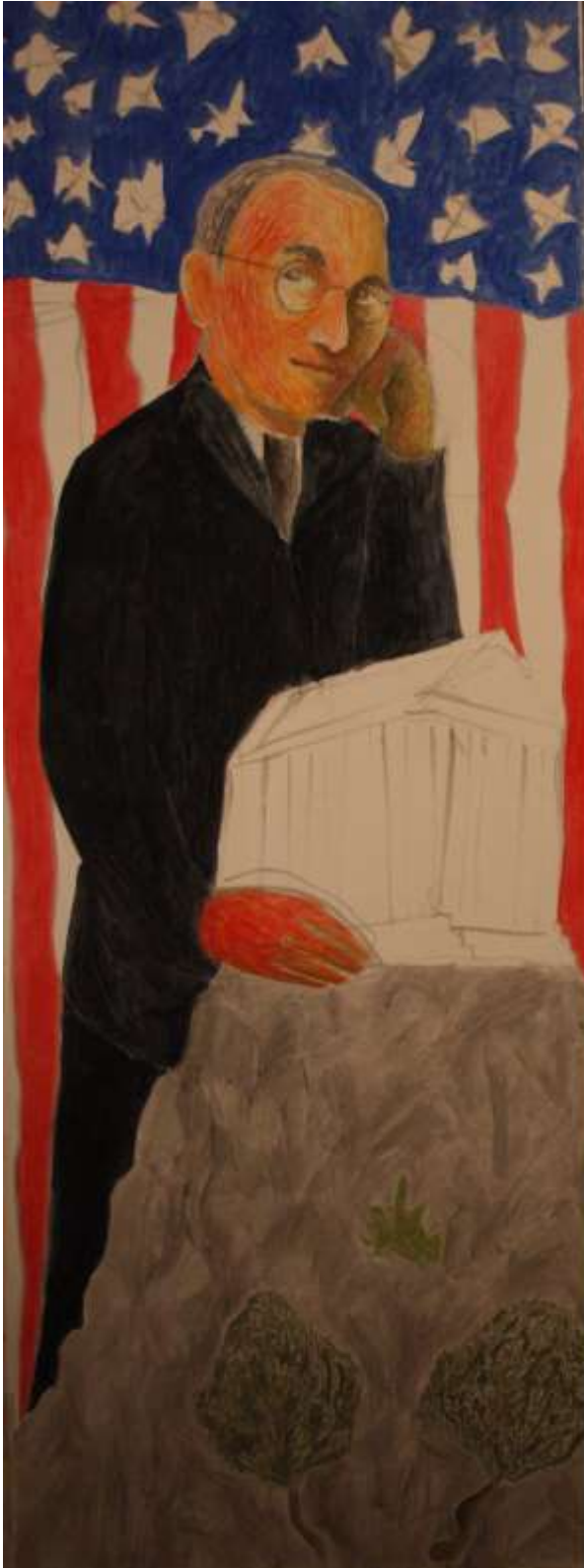
Εικόνα 6 Τρούμαν, 137 x 47, λάδι σε χαρτί

Οι δύο αρχηγοί. Ο ένας έχοντας στην πλάτη του το εθνικό του λάβαρο, ο άλλος το πηχτό σκοτάδι. Ο ένας σκεφτόμενος με ελαφρύ μειδίαμα τα κέρδη που θα αποκομίσει, ο άλλος ελπίζοντας για τα ωφέλη που θα λάβει. Ο ένας βάζοντας χέρι στην «περιουσία» ενός λαού, ο άλλος υπογράφοντας να βάλουν χέρι. Σχέσεις υποτέλειας.