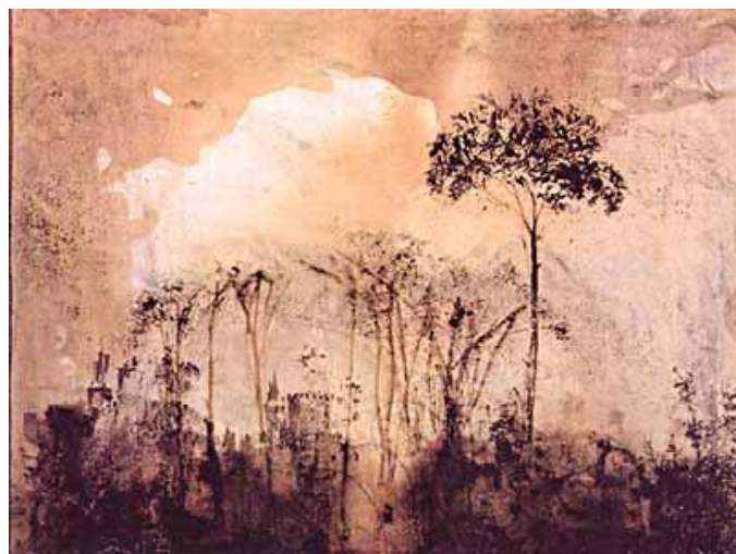
Βίκτωρ Ουγκώ, Το όμορφο κάστρο