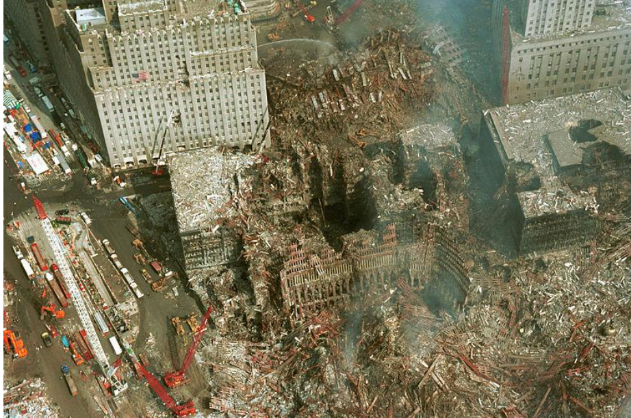
εναέρια άποψη του κτιρίου έξι του WTC μετά την 9/11, NY

Από τον Πύργο της Βαβέλ του Bruegel μέχρι τα ερείπια στο παγκόσμιο κέντρο εμπορείου της Νεας Υόρκης η εικόνα του αρχιτεκτονικού ερείπιου είναι άρρηκτα συνδεδεμένη με την μνήμη, επηρεάζει και φορτίζει συναισθηματικά, υπηρετεί ιδεολογικούς σκοπούς και μετατρέπεται σε ένα μέσω ανάγνωσης στην άνοδο και στην πτώση της κοινωνίας.