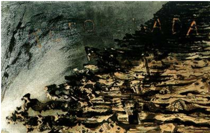
Βίκτωρ Ουγκώ, Torquemada