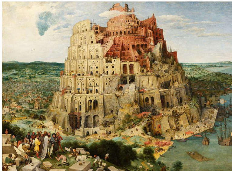
Pieter Bruegel the Elder, oil on panel, 114 cm × 155 cm, Kunsthistorisches Museum, Vienna