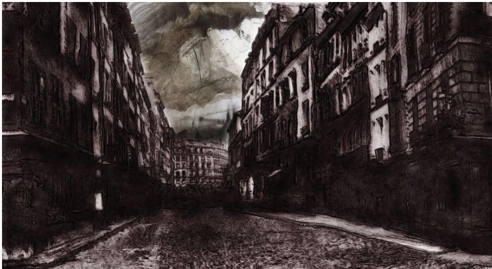
Βίκτωρ Ουγκώ, Οδόφραγμα

Ο Ουγκώ (1802-1885) εκτός από συγγραφέας βιβλίων που καταγράφουν με τον πλέον διερευνητικό τόπο την ανθρώπινη περιπέτεια ήταν και ένας εξαιρετικός ζωγράφος που μπόρεσε να δημιουργήσει ένα εξαιρετικό σώμα εικόνων. Δημιουργούσε σχέδια με μελάνι και άλλες φθαρτές ύλες. Τα έργα του αποτελούν συμβολιστικές ονειρικές υπερβάσεις και συχνά είναι φτιαγμένα με ύλη όπως νερό από καφέ, τσάι και άλλα παρεμφερή υλικά. Ταυτόχρονα με τις αυτοματικές τεχνικές που χρησιμοποιούσε θεωρείται σε πολλές περιπτώσεις από τους πρόδρομους του Μοντερνισμού.