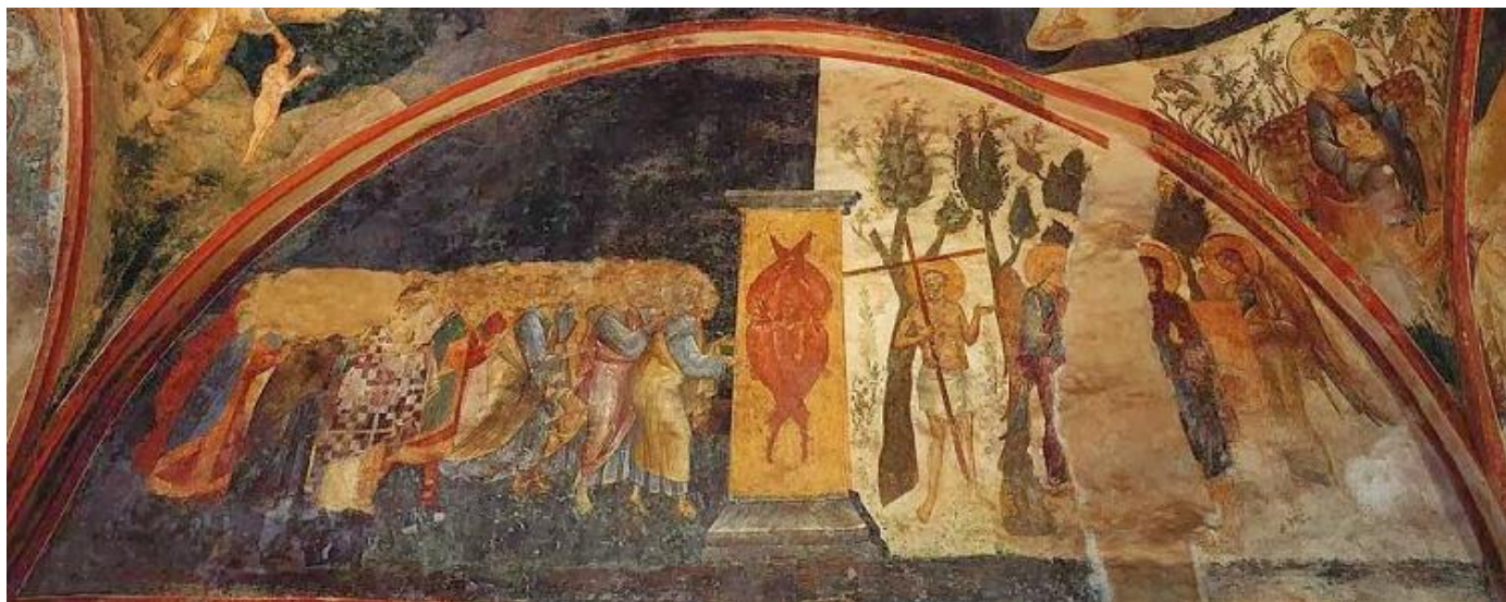
Οι Άνθρωποι στον Παράδεισο, φρέσκο, Μονή της Χώρας, 1316-1321