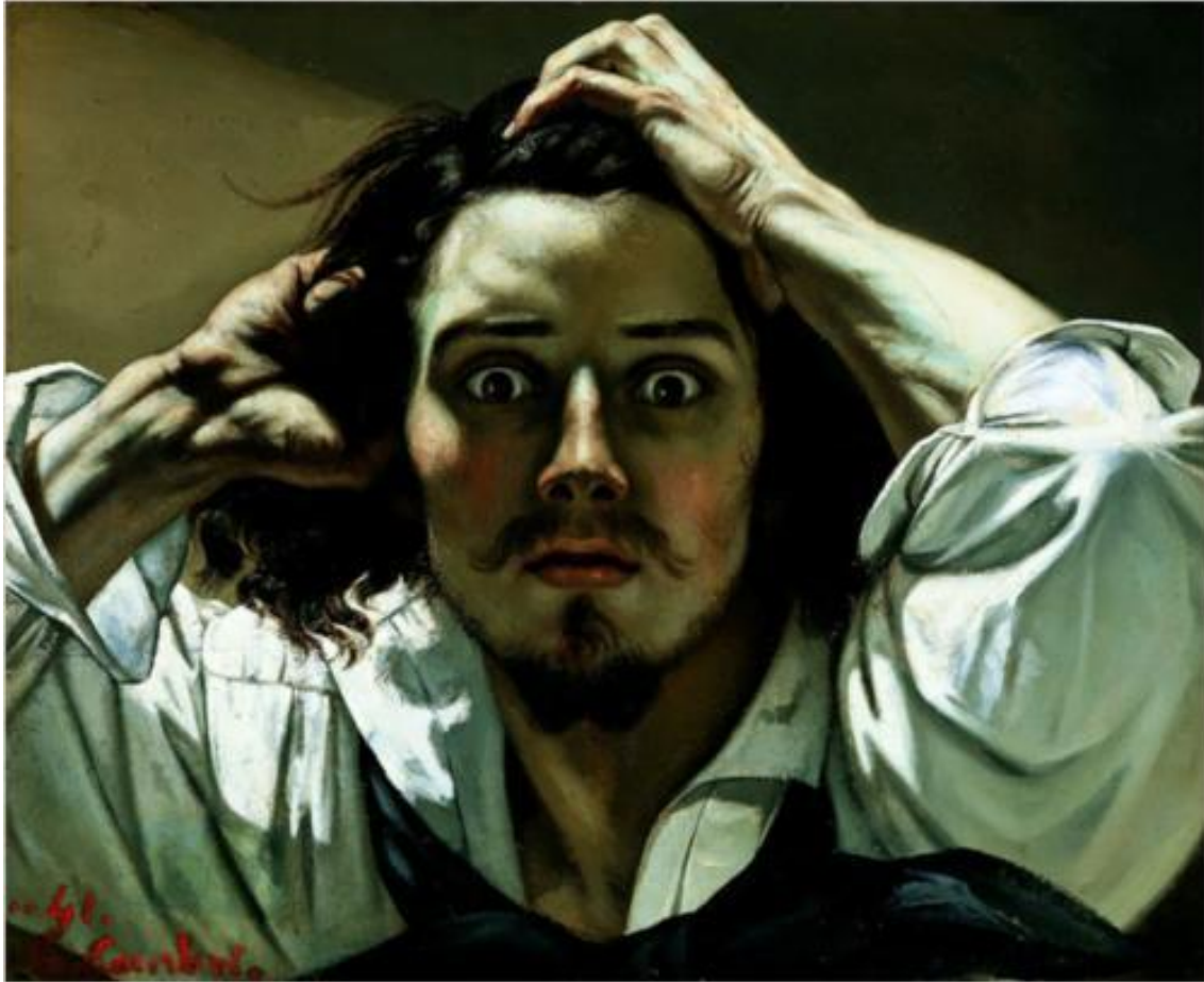
Γκουστάβ Κουρμπέ, Αυτοπροσωπογραφία/απελπισμένος άνθρωπος , 45x54 εκ. λάδι σε μουσαμά, ιδιωτική συλλογή, 1845

Στα πορträίτα εκείνης της περιόδου ο Κουρμπέ καταγράφει την ένταση και την πίεση που ο καλλιτέχνης συναισθάνεται όταν αντιμετωπίζει τον φόβο. Κινείται πάνω από ένα κενό χρωμάτων και αιωρούμενος. Θα βυθιστεί στο χάος της ζωγραφικής ύλης ή θα παραμείνει αιωρούμενος στην παρουσία της πραγματικότητας;