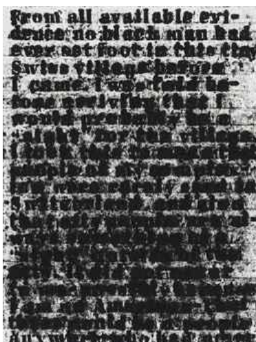
Glenn Ligon, Stranger#44 , λάδι σε μουσαμά με γκέσο, 183x152 εκ. , 2011

Ο Ligon αναπαράγει το κείμενο μέχρι να καταστεί και αυτό αόρατο. Το Μαύρο για τον Ligon έχει γενικότερα καθοριστική σημασία στο έργο του. Ο ίδιος θεωρεί τον εαυτό του εννοιολογικό καλλιτέχνη που χρησιμοποιεί τη ζωγραφική ως μέσο