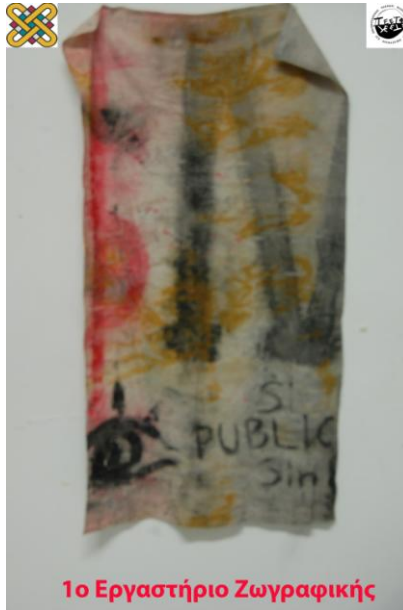
1ο Εργαστήριο Ζωγραφικής