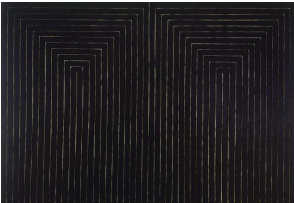
Frank Stella, The Marriage of Reason and Squalor, II , Enamel on canvas, 230.5 x 337.2 cm, 1959

Το Μαύρο ως φορμαλισμός: το έργο του Frank Stella