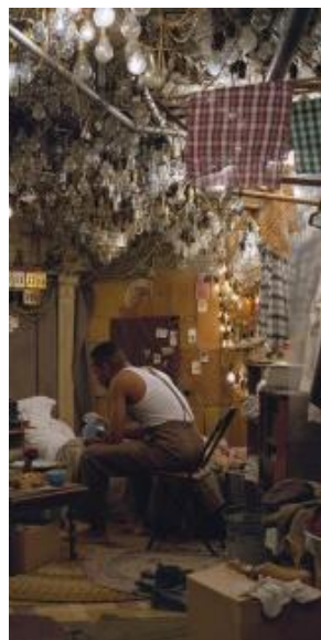
Jeff Wall After "Invisible Man" by Ralph Ellison, the Prologue

Silver dye bleach transparency; aluminum light box 174 x 250.8 εκ. 2000