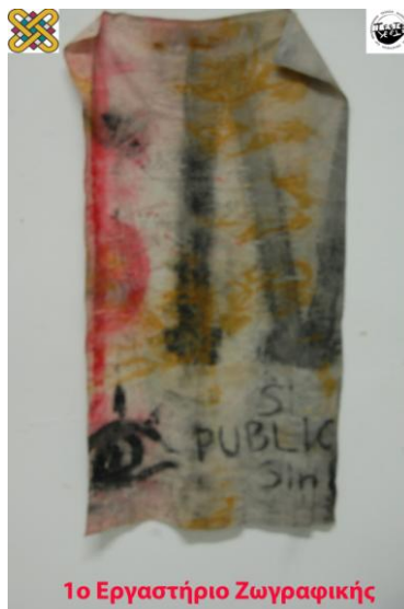
1ο Εργαστήριο Ζωγραφικής