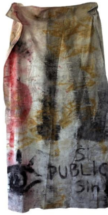
1 ο Εργαστήριο Ζωγραφικής