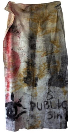
1 ο Εργαστήριο Ζωγραφικής