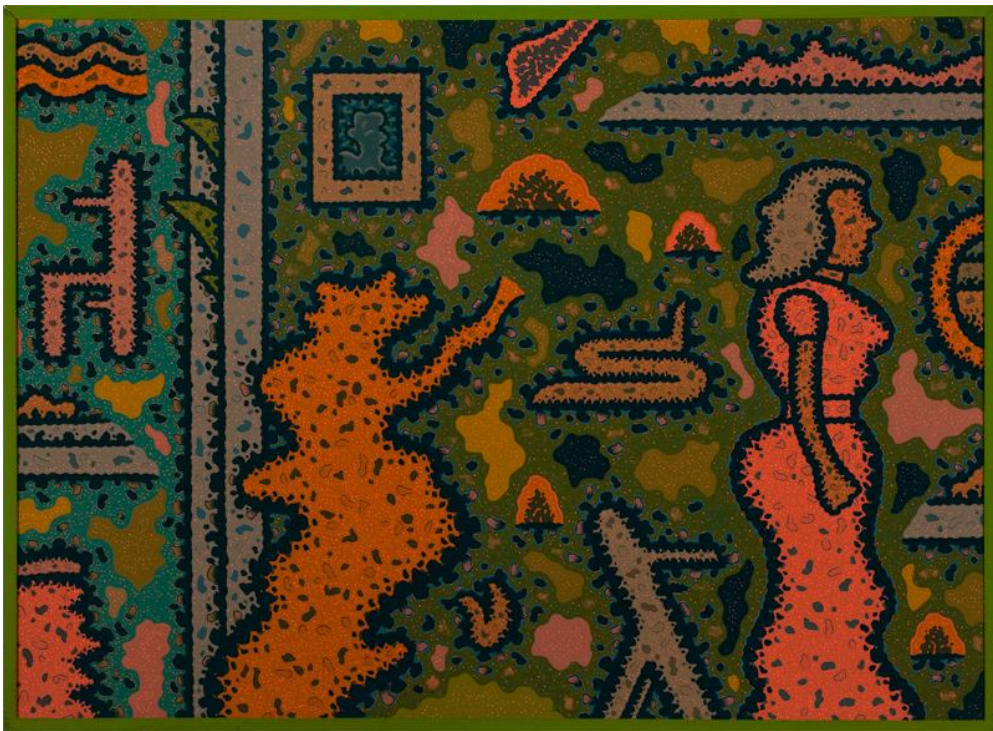
Ray Yoshida, Uncalculated Crossing , λάδι σε μουσαμά, 91x127cm, 1984